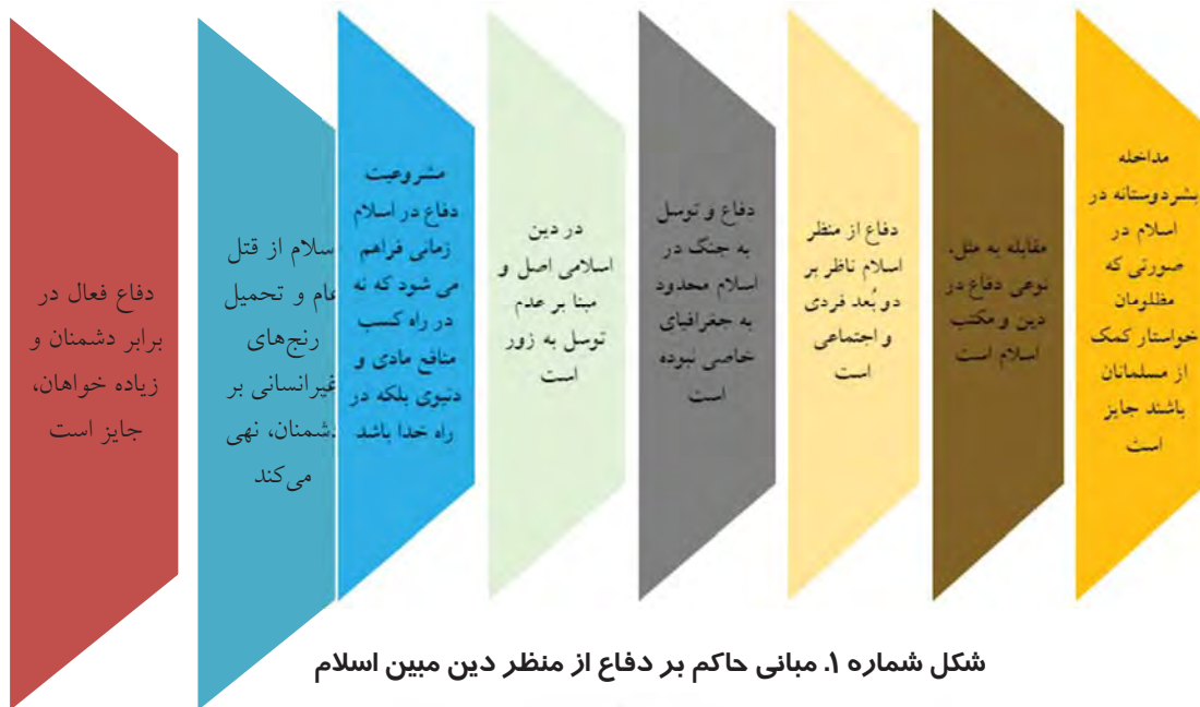
شکل شماره ۱. مبانی حاکم بر دفاع از منظر دین مبین اسلام