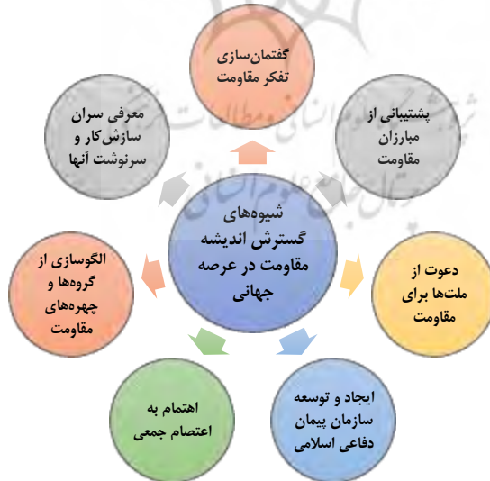
شکل ۲: شیوه‌های گسترش فکر مقاومت در جهان مبتنی بر دیدگاه آیت‌الله خامنه‌ای

یکی دیگر از نتایج اعتماد به حمایت آمریکا و دلخوش بودن به وعده‌های غرب، همان تحقیق‌ری بود که در دیدار دهم اسفندماه ۱۴۰۳ «دونالد ترامپ» رئیس جمهوری آمریکا و معاون او «جی دی ونس» با رئیس جمهوری اوکراین «ولودیمیر زلنسکی» در کاخ سفید در مقابل رسانه‌های جهان در کاخ سفید اتفاق افتاد. در این دیدار، رئیس جمهوری آمریکا بارها بر سر زلنسکی فریاد زد و سپس او را تهدید کرد و حتی مقامات آمریکایی (تا زمان تدوین این مقاله) در پی کنار گذاشتن زلنسکی از قدرت هستند ( https://www.mehrnews.com ). رئیس جمهوری اوکراین که با حمایت غرب و آمریکا و وعده پیوستن به ناتو درگیر جنگی ویرانگر و خانمان‌سوز با روسیه شد، علاوه بر تلفات فراوان و خسارات بی‌شماری که در این جنگ متحمل شد، اکنون با روی کار آمدن «دونالد ترامپ» حمایت آمریکا را از دست داد و مورد تحقیر گرفت. آیت‌الله خامنه‌ای، در سه سال گذشته به کشورهایی که پشت‌گرمی آن‌ها به آمریکا است، در بیان عبرت‌های مهم از قضایای اوکراین، هشدار داده بودند: «پشتیبانی قدرت‌های غربی از کشورها و دولت‌هایی که دست‌نشانده آن‌ها هستند، یک سراب است، واقعیت ندارد؛ این را همه دولت‌ها بدانند. آن دولت‌هایی که پشت‌گرمی آمریکا و به اروپا است، ببینند وضع امروز اوکراین و دیروز افغانستان را» (خامنه‌ای، بیانات: ۱۴۰۰/۱۲/۱۰).