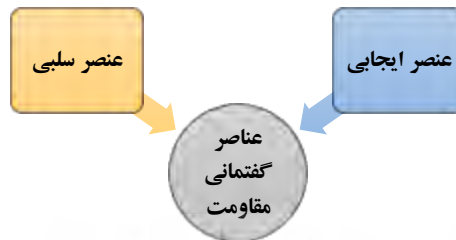
شکل ۱: عناصر گفتمانی مقاومت اسلامی

عناصر گفتمانی مقاومت اسلامی را می‌توان در دو دسته طبقه بندی کرد؛ یک بخش نفی یا سلبی است و بخش دیگر اثباتی و ایجابی.