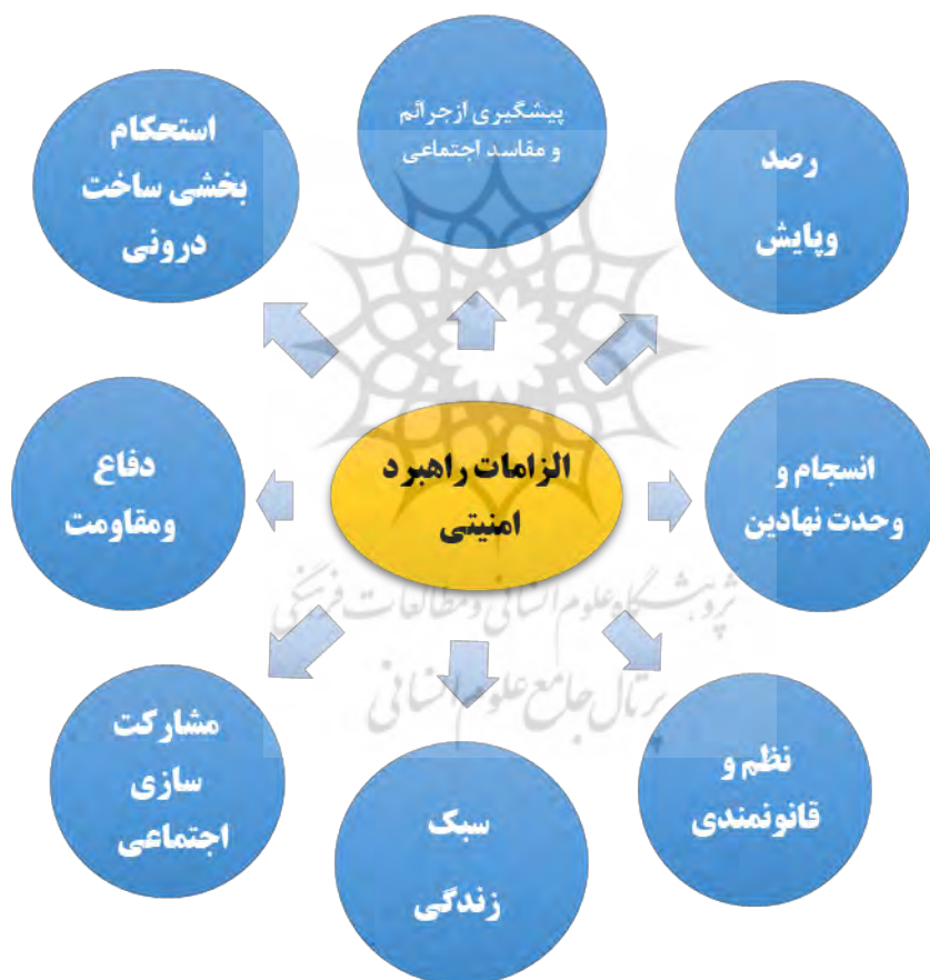
شکل ۱: هشت رویکرد در راستای ارتقای امنیت ملی

ملی قرار دارند. همچنین در کنار این محورها، می‌توان به دو عنصر مکمل دیگر نیز اشاره کرد: پایبندی به نظم و قانونمندی به‌عنوان پیش‌نیاز کارآمدی نظام و انسجام اجتماعی و نیز سبک زندگی مردم که ضامن حفظ مشروعیت و پایداری درونی نظام در برابر تهدیدات بیرونی است. درنهایت، تدوین این بخش، مبتنی بر بررسی ساختاریافته مجموعه‌ای از بیانات آیت‌الله خامنه‌ای با بهره‌گیری از روش تحلیلی مضمون‌محور انجام شده است. بدین ترتیب، مسیر دستیابی به این راهبردها از جنبه روشی نیز روشن و شفاف بوده و می‌تواند معیارهای علمی لازم در مطالعات مفهومی - راهبردی را برآورده نماید.