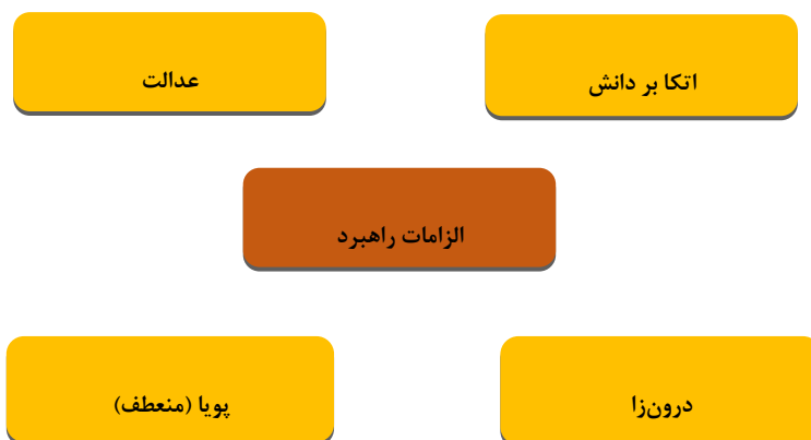
شکل ۲: الزامات راهبرد اقتصاد مقاومتی