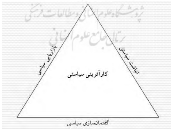
شکل ۱. مثلث چارچوب نظری پژوهش.

در ادبیات کلاسیک، احزاب ابزار سازمان‌دهی نخبگان و تسهیل مشارکت شهروندان در نظام نمایندگی تلقی می‌شوند. با این حال، در شرایطی که دموکراسی‌های نوظهور با ضعف نهادهای مدنی و فرهنگ حزبی مواجه‌اند، احزاب غالباً از ایفای نقش مؤثر در تولید سیاست و چشم‌انداز ملی بازمی‌مانند. در چارچوب نظری این پژوهش، سه کارکرد اصلی احزاب سیاسی مورد توجه قرار گرفته است که عبارت‌اند از: گفتمان‌سازی سیاسی، آبازاریابی سیاسی و انباشت سیاستی. در واقع نظام انتخابات در ایران و ساختار حزب در ایران در هر سه این موارد دچار مشکل است. گفتمان‌سازی به‌عنوان فرایند اجتماعی‌سازی و تسری بخشی مفاهیم و ارزش‌های سیاسی، نقش مهمی در تبیین مسائل عمومی و شکل‌دهی به هویت سیاسی بازی می‌کند. بازاریابی سیاسی نیز شامل بهره‌گیری از فرصت‌های نهادی و فضای رقابت برای ترویج ایده‌های سیاسی و سیاستی احزاب است. در نهایت، انباشت سیاسی ناظر بر پیوستگی و تداوم سیاست‌گذاری در راستای اهداف کلان و بلندمدت و طراحی چشم‌انداز است.