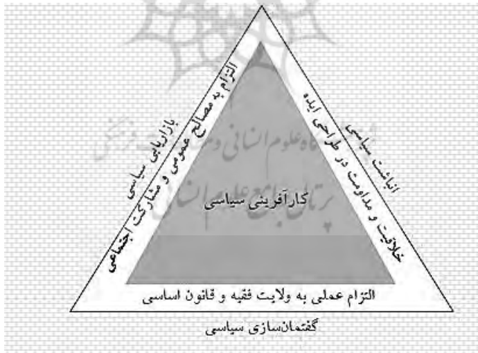
شکل ۲. مؤلفه‌های کارآفرینی سیاسی در احزاب ایرانی.