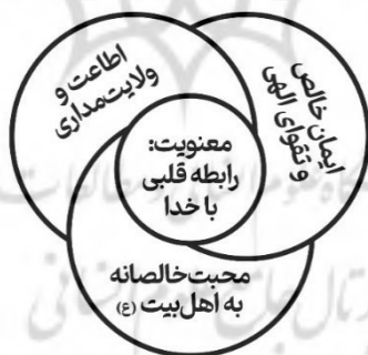
شکل ۲: حلقه‌های معنویت در نقش آفرینی اسماء در شکل‌دهی ارزش‌های شهیدپروری

عشق به اهل بیت (ع) زمینه‌ساز عشق به خداوند است و دوست داشتن آنان به معنای مهرورزی به ارزش‌های والای الهی است. رسیدن به کمالات معنوی و انسانی عالی بدون دوستی انوار الهی امکان‌پذیر نیست و حتی پذیرش اعمال نیز مشروط به محبت و ولایت اهل بیت (ع) است. (ر.ک، شکل ۲، حقله سوم) از آثار مهم محبت می‌توان به حرکت آفرینی، پویایی، اطاعت‌پذیری، انس با محبوب، کسب آرامش، اطمینان و امید به آینده اشاره کرد. تنها نقطه روشن و امیدبخش در زندگی پر از سختی اسماء، عشق به خاندان پیامبر (ص) و به‌ویژه خدمت به حضرت زهرا (س) بود. (یعقوبی، ۱۳۴۳، ۱۱۵/۲) نقل‌های تاریخی متعددی مبین ارادت و خدمت صادقانه این بانوی گرامی به حضرت زهرا (س) و امیرالمؤمنین (ع) است، از جمله: حضور در جایگاه شاهد برای حضرت زهرا(س) در جریان فدک (محلای، ۱۳۶۹، ۲۴/۲)، حضور بر بالین حضرت زهرا(س) هنگام شهادت ایشان (یعقوبی، ۱۳۴۳، ۱۱۵/۲)، خوشحال نمودن حضرت زهرا(س) با ساخت تابوت ویژه برای ایشان (امین، ۱۴۰۳، ۳۰۷/۳)، شرکت در غسل و تشییع حضرت زهرا(س) براساس وصیت آن حضرت (اربلی، ۱۳۸۱، ۱۲۲/۲)، حفاظت از جان امیرالمؤمنین(ع) در برابر توطئه قتل آن امام (محلای، ۱۳۶۹، ۳۰۸/۲)، نقل احادیثی در مورد منزلت و فضیلت امیرالمؤمنین (ع) (الشیروانی، ۱۴۱۷) و ... .