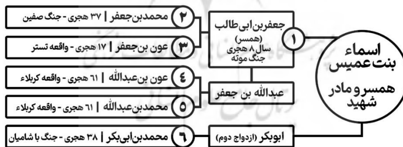
شکل ۱: اطلاع نگاشت از شمار شهدای خانواده جعفر (همسر، فرزندان و نوادگان اسما بنت عمیس)

محمد بن ابی بکر، هرچند فرزند مشترک اسما و جعفر نبود، اما در دامان مادری چون اسما و در کنار برادران خود از جعفر بن ابی طالب پرورش یافت و یکی از فرماندهان و شهدای والامقام تاریخ اسلام به‌شمار می‌رود. وی در جنگ‌های حضرت علی (ع) علیه مخالفان، ایشان را همراهی کرد؛ به‌ویژه در جنگ جمل که امیرالمؤمنین (ع) را بر خواهرش، عایشه، ترجیح داد و در سپاه ایشان جنگید. پس از آن، با عزل قیس بن سعد از حکومت مصر، به پیشنهاد برادرش، عبدالله بن جعفر، به حکومت مصر انتخاب شد (الثقفی، ۱۳۵۵، ۲۱۲/۱)، اما محمد بن ابی بکر در مصر از سپاه عمرو بن عاص شکست خورد. دشمنان با نهایت قساوت او را به شهادت رساندند و جسدش را در پوست الاغ نهاده و آتش زدند (ابن شیهه نمیری، ۱۴۱۰ هـ.ق، ۱۲۸۵/۴). خبر این واقعه برای مادرش، اسما، چنان دردناک بود که به نمازخانه خود رفت و از شدت خشم، خون از سینه‌اش جاری شد (الثقفی، ۱۳۵۵، ۲۸۷/۱). امام علی (ع) درباره او فرمود: «محمد، پسر من از صلب ابوبکر است» (ابن ابی الحدید، ۱۳۸۵، ۵۳/۶).