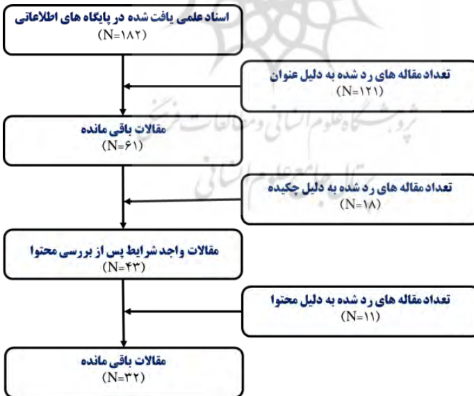
شکل ۲: جستجو و انتخاب مقالات مناسب

خلاصه‌ای از فرایند ارائه‌شده به همراه نتایج به‌دست آمده مشاهده می‌شود.