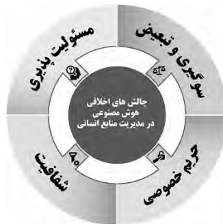
شکل ۳: چالش‌های اخلاقی هوش مصنوعی در مدیریت منابع انسانی