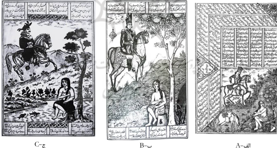
شکل ۵. الف. چاپ سنگی استحمام شیرین در چشمه و دیده‌شدن توسط خسرو: سال ۱۲۶۴ ه.ق. (کاظمی، ۱۳۸۶، ص. ۵۸). ب. چاپ سنگی استحمام شیرین، سال ۱۲۶۹ ه.ق. (خمسه‌ی نظامی، ۱۲۶۹، ص. ۶۷). ج. چاپ سنگی استحمام شیرین، اصفهان، ۱۸۰ × ۱۲۳ سانتی‌متر، اوایل قرن ۱۴ ه.ق.، مجموعه‌ی خصوصی (تناولی، ۱۳۶۸، ص. ۶۴)

پیدایش صنعت چاپ در دوره‌ی قاجار موجب رواج کتب چاپ سنگی شد و بسیاری از صحنه‌های داستان خسرو و شیرین از جمله تصویر آب‌تنی شیرین به صورت چاپ سنگی منتشر شدند و در دسترس عموم قرار گرفتند (شکل ۵).