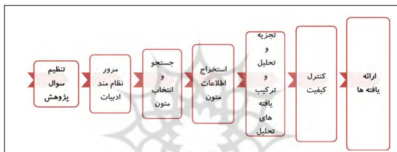
شکل شماره ۱

پژوهش حاضر از نظر هدف بنیادی و از حیث نحوه به دست آوردن داده‌ها توصیفی و به لحاظ روش‌شناسی کیفی و با استفاده از روش فراترکیب است. در این پژوهش به منظور تحقق هدف پژوهش از روش هفت‌مرحله‌ای سندلوسکی و باروسو ۱ استفاده شده است که مراحل آن در شکل شماره ۱ نشان داده شده است.