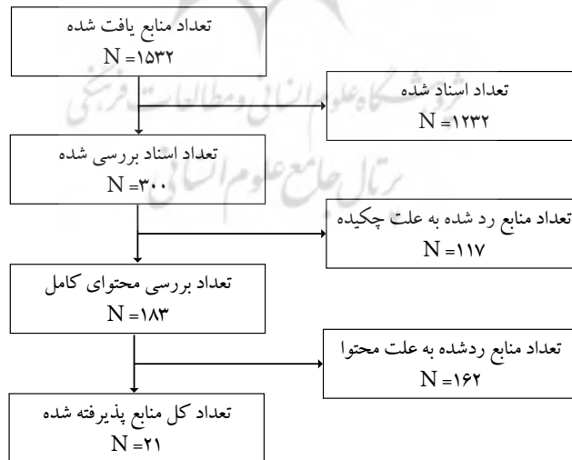
شکل شماره ۲

جستجو و انتخاب مقالات مناسب: بدین منظور بیش از ۱۵۳۲ اسناد علمی (مقالات و پایان‌نامه) بر اساس عنوان بررسی شد. برای بررسی، در صفحات پایگاه‌های اطلاعاتی مرتب، کلید واژه‌ها مورد جستجو قرار گرفتن و عناوین اسناد یافته شده بررسی و گزینش شد. در این مرحله از بررسی و پالایش اسناد، تعداد ۱۲۳۲ سند رد شد؛ چراکه عنوان آن‌ها بر مسئله و متغیرهای پژوهش حاضر منطبق نبود. ۳۰۰ سند باقیمانده، مورد بررسی چکیده قرار گرفت تا بتوان مشابهت‌ها و رهیافت‌هایی برای پژوهش حاضر در آن‌ها یافت. در این بررسی که به مطالعه دقیق چکیده مطالعات پرداخته شد تعداد ۱۱۷ سند دیگر از بررسی خارج شد. در نهایت با مطالعه اجمالی محتوا، ۱۶۲ سند رد گردید. برای این منظور بخش‌های کلیدی اسناد از جمله بیان مسئله، ادبیات، روش، یافته‌ها و نتایج مورد بررسی اجمالی قرار گرفت. تا این احتمال بررسی شود که این اسناد، محتوایی برای استخراج و استفاده در پژوهش حاضر داشته باشند. سرانجام ۲۱ سند باقی ماند و اطلاعات آن‌ها استخراج شده و مورد تحلیل قرار گرفت که در گام‌های بعدی فراترکیب بدان‌ها اشاره شده است. معیار سنجش کیفیت مقالات و پایان‌نامه‌های نهایی از نظر شاخص‌های دهگانه کپس (caps) که شامل ۱۰ شاخص بیان واضح اهداف، مناسب بودن روش کیفی، تناسب طرح تحقیق با اهداف پژوهش، استراتژی مناسب با اهداف تحقیق، شرح شیوه گردآوری داده‌ها، در نظر گرفتن رابطه بین محقق و پاسخگو، در نظر گرفتن مسائل اخلاقی، دقت در تجزیه و تحلیل داده‌ها، شفاف‌سازی نتایج و ارزش کلی مقاله مورد بررسی هستند، می‌باشند.