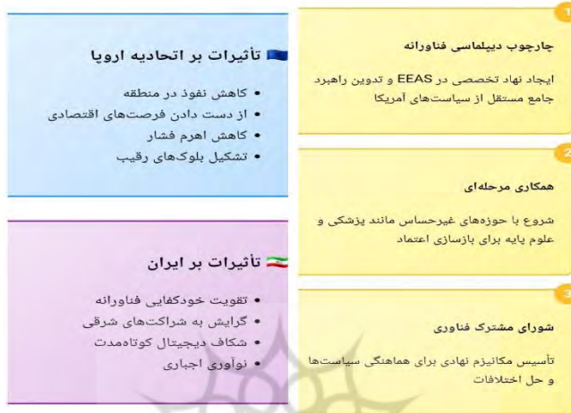
شکل ۲: جمع‌بندی تأثیر و راهبردها

سایر کشورها نشان می‌دهد که انگیزه‌های اقتصادی می‌تواند موتور محرک همکاری‌های بلندمدت باشد. با توجه به این توضیحات می‌توان پیشنهادهای پیش رو را به شکل زیر خلاصه کرد.