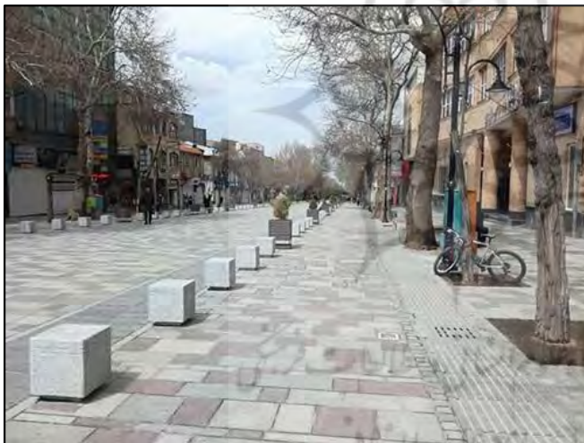
شکل شماره ۲: محور بوعلی همدان

داده‌های حاصل از این مشاهدات با تحلیل‌های پرسش‌نامه‌ای ترکیب شده و مبنای تحلیل مقایسه‌ای میان برداشت‌های ذهنی (از طریق پرسش‌نامه) و شاخص‌های عینی (از طریق مشاهده) قرار گرفتند. برای پرهیز از رویکرد صرفاً توصیفی، مشاهدات به‌صورت مقایسه‌ای در بازه‌های زمانی مختلف تحلیل شدند. این تحلیل شامل مقایسه میانگین تراکم عابران، شدت روشنایی و تنوع فعالیت‌ها در دو فصل و دو نوع روز (عادی و تعطیل) بود.