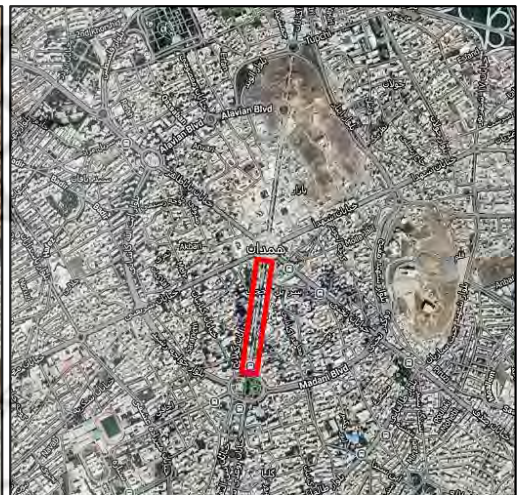
شکل شماره ۱: نقشه موقعیت مکانی، خیابان بوعلی همدان