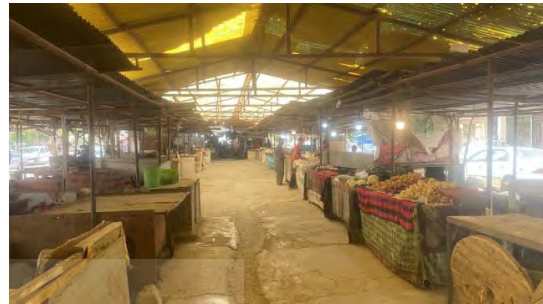
شکل ۴. تصاویری از فعالیت بخش غیررسمی در محله دولت‌آباد

از این‌رو انگ مکانی زمانی با کمبود خدمات شهری و ناامنی ادراک‌شده هم‌نشین می‌شود، از سطح کلیشه به سازوکاری برای «کنترل دسترسی» بدل خواهد شد: کنترل به شغل، به شبکه‌های رسمی و حتی به کرامت نمادین. در دولت‌آباد، بازار و شبکه‌های درون‌گروهی، بخشی از این کنترل را «خنثی» می‌کند؛ در آقاجان، فقدان این اهرم‌ها، انگ را به هسته‌ای هویت مکانی بدل کرده است.