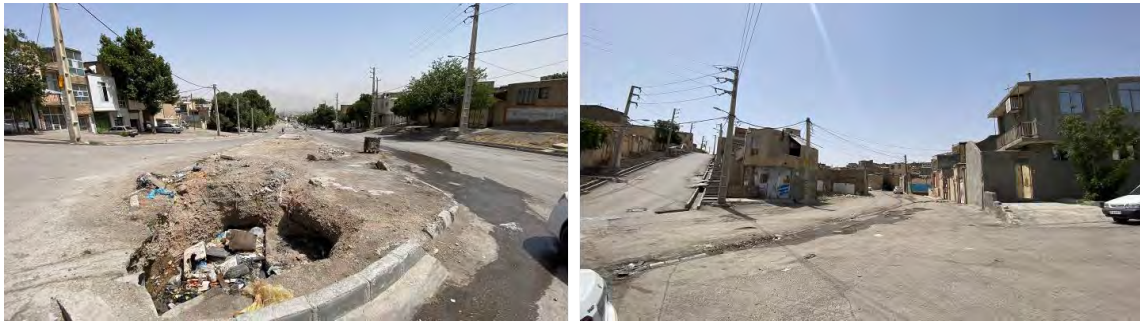
شکل ۵. تصاویری از محله کولی‌آباد (فقدان پویایی فضا و نظارت اجتماعی)