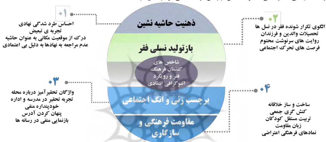
شکل ۱. چارچوب مفهومی پژوهش

در چنین بستری، ضرورت بازاندیشی در فهم فقر به‌مثابه امری اجتماعی و ساختاری، و بازخوانی تجربه‌های زیسته‌ی گروه‌های فرودست در بسترهای تاریخی-جغرافیایی متفاوت، بیش از پیش برجسته می‌شود (شکل ۱).