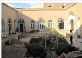
استفاده از پنجره‌های ساده در خانه عبدالرزاق (دوره پهلوی)