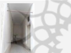
دالان خانه پورشمسی (دوره پهلوی)