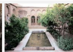
حوض آب خانه مشروطه (دوره قاجار)

نمی‌شود. آنچه در گذر زمان دگرگون می‌شود، «پوششی» است که بر معماری هر عصر پوشانده می‌شود. در حقیقت در هر دوره تاریخی صورتی متناسب با شرایط فرهنگی، اجتماعی و اقلیمی، در قالبی نو، اما با معنایی پایدار در بنای معماری جلوه‌گر می‌شود. مبتنی بر این مفاهیم در معماری اصیل هم‌زمان به مراتب مفهوم، معنا و صورت در بنا توجه می‌شود و مخاطب را در مراتب ادراکی از صورت به معنا سیر می‌دهد. اصالت در مرتبه صورت در کالبد و ظاهر بنا، نمود می‌یابد و بیش از سایر مراتب تحت‌تأثیر زمان، فرهنگ، اجتماع و شرایط محیطی قرار می‌گیرد. در مرتبه مفهوم، اصالت همچنان در بستر زمان و مکان تداوم دارد و در مرتبه معنا، اصالت در جوهر و ذات اثر متجلی می‌شود و باوجود تغییرات صوری، معانی بنیادین مستتر در بنا همچنان حفظ می‌شود. بررسی مؤلفه‌های اصالت در مراتب سه‌گانه در خانه‌های دوره قاجار و پهلوی نشان می‌دهد که با تغییر یا حذف برخی عناصر و جزئیات در بنا از جمله شکل، ظاهر، ابعاد و اندازه، معانی و مفاهیم در آن عناصر دیگر امکان ظهور نمی‌یابد. در خانه‌های سنتی دوره قاجار، معانی و مفاهیمی چون حریم، درون‌گرایی، سلسله‌مراتب، شفافیت، وحدت و ... در فرم و عناصر معماری از قبیل جلوخان،