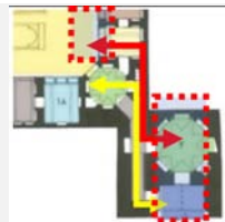
تفکیک فضاها با عناصر جداکننده (هشتی، راهرو و ایوان) خانه مرتاض (دوره قاجار)