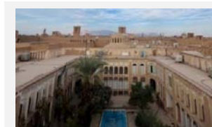
وحدت در خانه مرتاض (دوره قاجار)