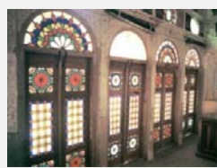
استفاده از پنجره گره‌چینی با شیشه رنگی خانه لاری‌ها (دوره قاجار)