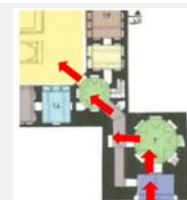
سلسله مراتب دسترسی ورود به خانه مرتاض (دوره قاجار)

بدین ترتیب، مؤلفه‌های مرتبه معنا در خانه‌های دوره قاجار، متناسب با سطح ادراک مخاطب در اجزای مختلف بنا قابل مشاهده است. با این حال، در خانه‌های دوره پهلوی، به دلیل حذف