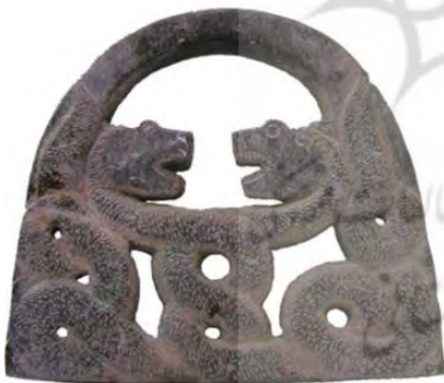
شکل ۸: شیء سنگ صابونی، یافت شده از جیرفت، ۳۰۰۰ ق.م. بلندی: ۲۵، عرض: ۲۸ و ضخامت: ۳ سانتیمتر، (مجیدزاده، ۱۳۸۲: ۱۲۳).