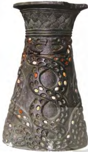
اشکال ۶ و ۷: ظرف سنگ کلریتی و نقش گسترده آن، یافت شده از جیرفت، حدود ۳۰۰۰ ق.م (مجیدزاده، ۱۳۸۲: ۹۹).