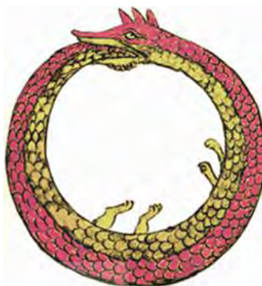
شکل ۱: اوروبوروس، ماری که دمش را گاز می‌گیرد (باستانی پاریزی، ۱۳۸۸: ۱۰۴).

زندگی می‌تراود و زندگی از مرگ (دوبوکور ۱۳۸۷: ۴۳). در اساطیر بین‌النهرین مار به‌عنوان نماد آغازین ظاهر می‌شود. تیامات ۲۵ مار و یا اژدها است و مظهر زاینده جهان. از او لخمو ۲۶ و لخامو ۲۷ مارهای نر و ماده، به‌صورت زوج آفریده شدند (ف.ژیران و همکاران، ۱۳۸۲: ۶۰-۵۸).