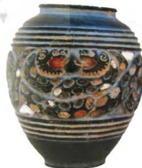
اشکال ۴ و ۵: ظرف کلریتی سنگ‌نشانی شده، به همراه نقش گسترش‌یافته آن، ۳۰۰۰ ق.م، یافت شده از جیرفت (مجیدزاده، ۱۳۸۲: ۹۸).