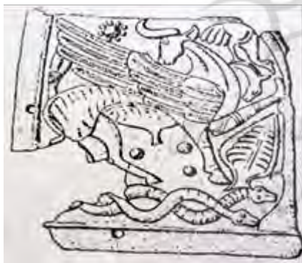
شکل ۳: لوحه کوه‌دشت، ۲۹۰۰ ق.م، دو مار در کنار نخل و گاو بالدار، که هر سه منسوب به خدای بزرگ باروری‌اند (گذار، ۱۳۵۸: تصویر ۴۷).

نقش مارهای درهم‌تنیده نیز چونان نقش یک مار به‌تنهایی حاوی معانی نمادین و به‌ظاهر متفاوتی است. هرساله و در فصولی خاص، این خزندگان خاک‌نشین (مارها)، در طلب ابقای نسل، درهم می‌پیچند (فرزان-پی، ۱۳۶۹: ۶۸). تصویر "دو مار درهم‌تنیده"، قدمتی هم‌پای قدیمی‌ترین تمدن‌ها دارد. در لوحه‌ای گلی که در کوه دشت (لرستان) یافت شده است، حضور دو مار در هم‌تنیده در زیر پای گاوهای بالدار که به‌عنوان نگهبانان درخت نخل دیده می‌شوند، حضور دارند و هر سه این نمادها به‌عنوان علائم مربوط به خدای بزرگ باروری محسوب می‌شوند (شکل ۳).