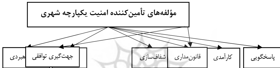
شکل ۱. مؤلفه‌های تأمین‌کننده مدیریت انتظامی و امنیت با رویکرد حکمروایی شهری (نگارنده، ۱۴۰۲)

بنا بر آنچه گفته شد، می‌توان شاخص‌های مؤثر در تأمین امنیت یکپارچه با رویکرد حکمروایی شهری را در قالب شکل زیر ارائه نمود که بیانگر مدل مفهومی پژوهش است و از ادبیات و مبانی نظری اقتباس شده است. توجه به این نکته ضروری است که در این مطالعه تأمین امنیت در مقیاس شهری مورد بررسی قرار خواهد گرفت. انجام تحلیل‌های مشابه در سایر مقیاس‌های ملی یا محلی امکان‌پذیر است که بررسی هر یک مطالعه جداگانه‌ای را می‌طلبد.