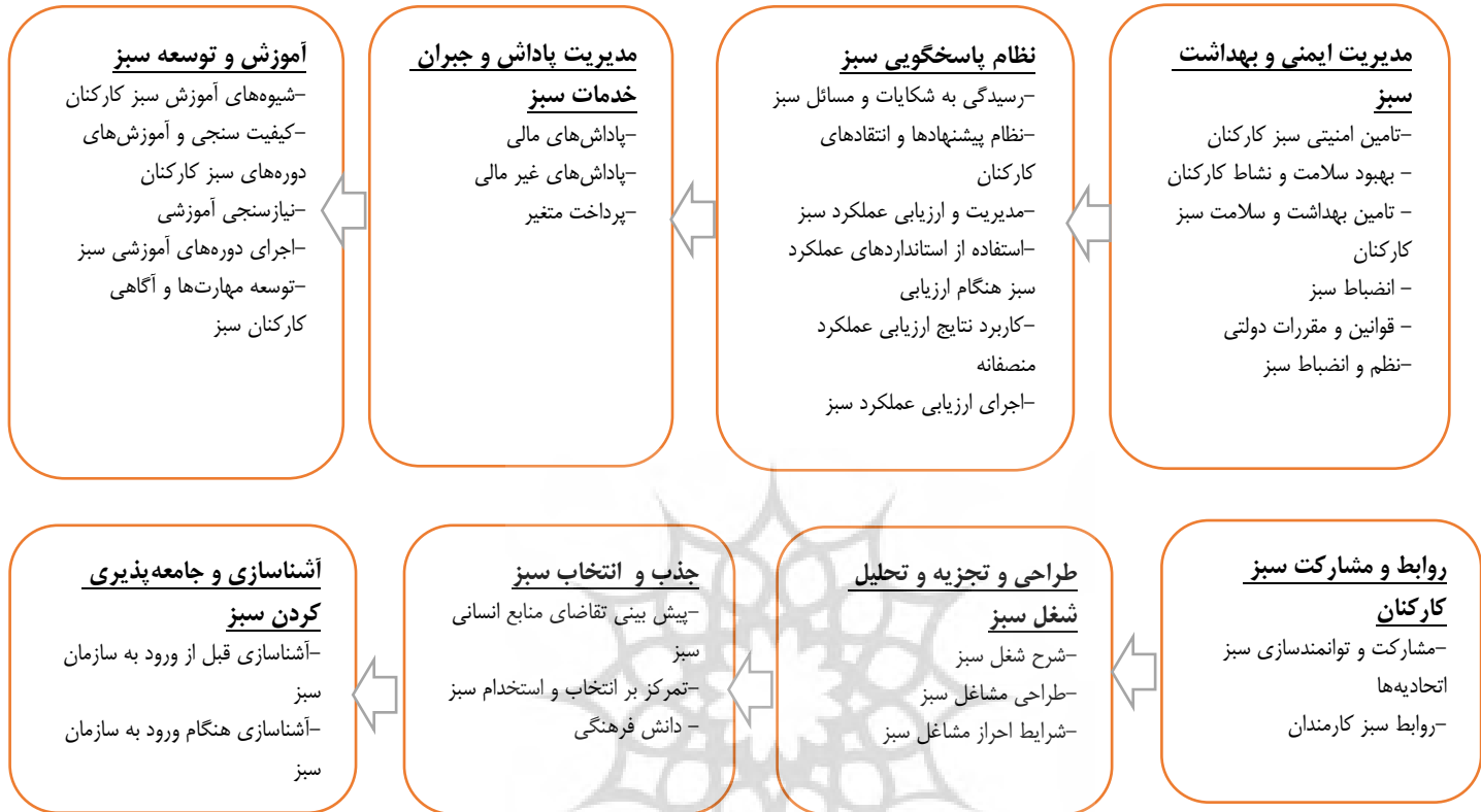
شکل ۲- مدل راهبردی مدیریت منابع انسانی سبز در شهرداری‌های استان مازندران

با توجه به نتایج پژوهش حاضر در بخش کیفی، طراحی مدل راهبردی مدیریت منابع انسانی سبز در شهرداری‌های استان مازندران در قالب شکل شماره (۱) ارائه شده‌است: