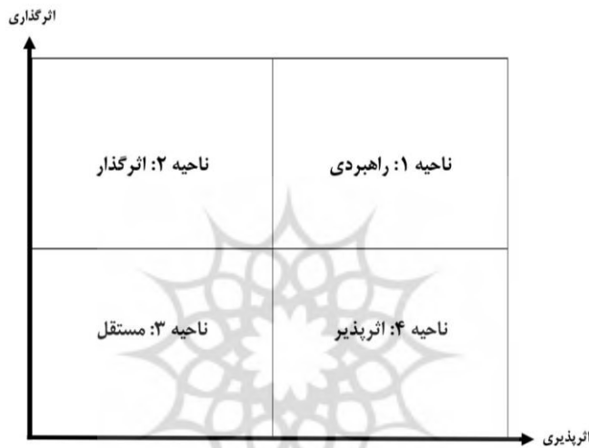
نمودار ۱. مختصات تحلیل تأثیر متقابل متغیرها (برگرفته از گلن و گوردون ۲ ، ۲۰۰۹)

می‌شود. چگونگی پراکنش و جای‌گیری متغیرها در صفحه نمودار، میزان پایداری یا ناپایداری سامانه را برای تحلیل‌گران مشخص می‌کند (گوده و همکاران ۱ ، ۲۰۰۳). در چارچوب این روش، دو الگوی اصلی از پراکنش متغیرها مدنظر قرار می‌گیرد: ۱. سامانه‌های پایدار ۲. سامانه‌های ناپایدار که در نمودار شماره ۲ نشان داده شده است. در این پژوهش نیز، پس از اجرای تحلیل ساختاری چالش‌های آینده حکمرانی کشور، وضعیت پایداری یا ناپایداری حکمرانی در افق مورد نظر، تحلیل و ارزیابی شده است.