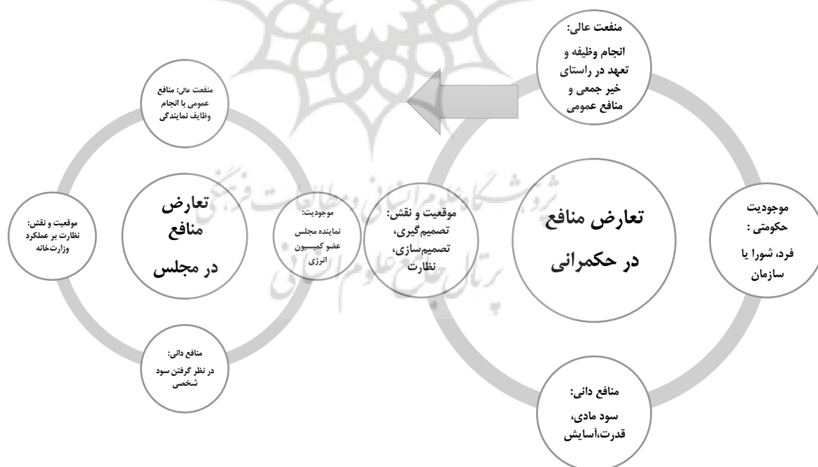
شکل ۱: ارکان شکل‌دهنده تعارض منافع در حکمرانی

با توجه به ۴ عنصری که در پنج مثال مذکور شناسایی شد به نظر می‌رسد از طریق استقرا بتوان ۴ رکن کلی را برای تعارض منافع برشمرد. در شکل شماره ۱، ۴ رکن در یک مثال، به تعریف کلی تعارض منافع عمومیت داده شده است: