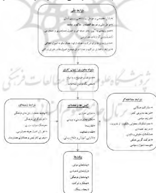
شکل ۱. الگوی پارادایمی پنهان کاری در حرفه حسابداری

بر اساس یافته های مرحله پژوهش کیفی و الگوی پارادایمی به دست آمده، الگویی فرضی تدوین گشت که شامل متغیرهای برون زا (که مشابه متغیرهای مستقل عمل کرده و مسیرها از این متغیرها شروع می شوند و اثری به آنها ختم نمی شود) از قبیل؛ شرایط علی (دانش تخصصی و عوامل روانشناختی نیروی انسانی، عوامل مالی و شرایط اقتصادی حاکم بر جامعه، عدم پایبندی به آیین رفتار حرفه ای و اصول حسابداری و حسابرسی، عدم پایبندی مدیران شرکت، حسابداران و حسابرسان به اصول اخلاقی، شرایط ساختاری شرکت و عدم اجرای صحیح اصول نظام راهبری شرکتی) شرایط زمینه ای (نهادینه شدن ارزش های فرهنگی، کثرت گرایی فرهنگی، فرهنگ دولت ستیزی، افزایش اعتبار حرفه حسابرسی، رهبری کار تیمی و همکاری حسابرسان)، شرایط مداخله گر (مشارکت همگانی، شرایط سیاسی، شرایط اقتصادی، شرکت گرایی دولتی، شرایط مدیریتی کشور، عدم تفکیک محتوایی مالکیت از مدیریت، مشکلات حقوقی و قانونی، توسعه نامتوازن سیاسی) و متغیرهای درون زا (که مانند متغیرهای وابسته عمل کرده، اثر مسیرها به آنها ختم می شود و ممکن است خود بر متغیر دیگری اثر داشته باشند) از قبیل؛ پدیده محوری (مخفی نگه داشتن اطلاعات، عدم افشای صحیح و بموقع اطلاعات)، کنش ها و تعاملات (افشای اختیاری، مکانیزم های درونی و بیرونی، نظارت ها، فقدان شفافیت، کارایی آموزش و اطلاع رسانی) و پیامدها (پیامدهای دولتی، پیامدهای اقتصادی، پیامدهای فرهنگی، عملکرد شرکت، ایجاد ریسک) می باشد.