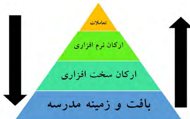
مدل مفهومی نقش زیست‌بوم مدرسه بر هویت‌یابی دانش‌آموزان

برای نمایش جامع رابطه بین مجموعه عناصر و تعامل پیچیده عوامل درونی و بیرونی مدرسه در شکل‌گیری هویت دانش‌آموزان، می‌توان این ارتباط را به صورت زیر ترسیم کرد.