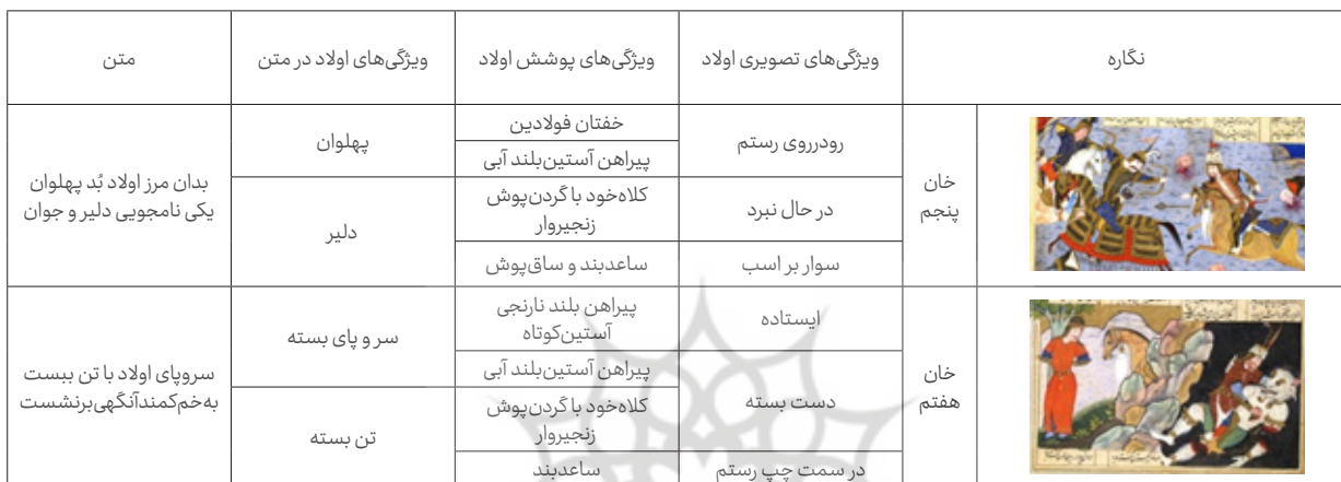
جدول ۱. ویژگی‌های متنی و بصری هویت انسان‌گونه اولاد در شاهنامه ۹۵۳ هـ.ق

بنا بر این، دو بار در متن خوان هفتم شاهنامه، در بند بودن و گرفتن بودن اولاد ذکر شده است که این تکرار و یادآوری می‌تواند دلیلی بر عدم هویت دیوگونه اولاد و تأییدی بر هویت انسان‌وار اولاد و ناتوانی وی در نجات خویش باشد. در نگاره‌های شاهنامه ۹۵۳ هـ.ق نیز اولاد در پیکری انسان‌گونه نمایان می‌شود اولین بار در خوان پنجم و در صحنه کارزار با رستم و دیگری در خوان هفتم و در هیبت مردی که به درختی بسته شده است. پوشش وی در دو نگاره متفاوت است. آنجا که با رستم می‌جنگد لباس رزمی فولادین بر تن و بر سر دارد و حتی اسب او نیز با بالاپوشی فولادین به تصویر درآمده است. در چنین هیبتی با رستم ببر بیان پوش روبرو شده است؛ اما در نگاره خوان هفتم وی همچون دیگر جنگاوران و درباریان، لباسی بر تن دارد که تنها وجه شباهت پوشش با لباس رزم، ساعدبند و کلاه خود است.