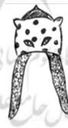
تصویر ۱۰. ببر بیان رستم (نگارنده)