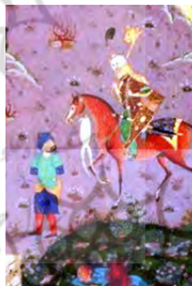
تصویر ۳. اولاد در خوان پنجم (شاهنامه طهماسبی)

حضور اولاد در شاهنامه در خان پنجم و هفتم است که طبق پژوهش انجام‌شده توسط ماه‌وان از ۱۱۱ نگاره متعلق به پیکره اولاد در نسخ قرون ۸ تا ۱۴ هجری چنین هویدا است که حدود ۱۷ نگاره مربوط به اولاد در خان پنجم است که ده نگاره آن اولاد را با پیکر دیو و هفت نگاره اولاد را انسان‌گونه به تصویر کشیده‌اند. حدود نود و چهار نگاره نیز مربوط به داستان خان هفتم است که هشتاد و هفت نگاره آن اولاد را انسان‌وار و هفت نگاره اولاد را هستی دیوی بخشیده‌اند. پژوهشگر در ادامه آمار داده‌شده به این نتیجه رسیده است که به تصویر کشیدن اولاد در چهره انسانی در خان هفتم نمودارکننده راست‌کرداری و راهنمایی درست به رستم بوده است (ماه‌وان،