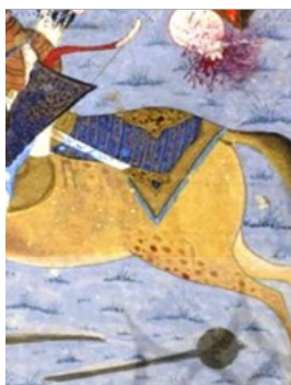
تصویر ۱۳. بلاپوش رخس (نگارنده: ۱۲: برگ ۷۷۳)

طبق توصیف تصویر پوششش اولاد و اسب وی چنین برداشت می‌شود که نگارگر شاهنامه ۹۵۳ هـ.ق، در صحنه نبرد رستم با اولاد وی را پوششی همچون پوشش رستم (ببر بیان) خاص به تصویر می‌کشد و به اسب وی نیز بر خلاف اسب رستم پوششی متفاوت و با خصوصیتی فولادی عطا می‌کند.