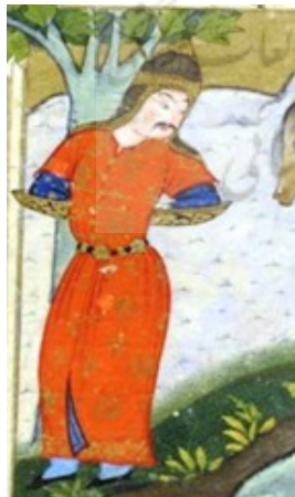
تصویر ۱۰. پوشش اولاد در خوان هفتم (نگارنده)

اولاد در این نگاره پیراهنی بلند تا حوالی مچ پا دارد که جلو باز بوده و دکمه‌هایی طلایی تا حوالی کمر دارد که دو سوی پیراهن را بسته کرده و چاک تا حوالی ساق پا نمایان است. این پیراهن آستین کوتاه و به رنگ نارنجی است. در زیر آن پیراهنی آستین بلند به رنگ آبی دیده می‌شود. کمربندی روی پیراهن بسته شده است. اولاد در این نگاره شلوار یا جورابی ساق بلند آبی روشن به پا دارد. ساعد بند نیز بر دستان اولاد مشاهده می‌شود. پوشش سر وی نیز همان کلاه خود نبرد پیشین بدون جقه و پرچم است (تصویر ۱۰).