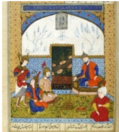
تصویر ۱۱. دیدار کیفیاد با سپاهیان و رستم (نگارنده: ۷: برگ ۵۹)

از نگاره پیشین بر تن دارد. با بررسی‌های تصویری انجام شده در نگاره‌های شاهنامه ۹۵۳ هـ.ق، جنگاوران و حتی عموم مردهای درباری پوششی همچون پوشاک اولاد در خان هفتم دارند (تصویر ۱۱).