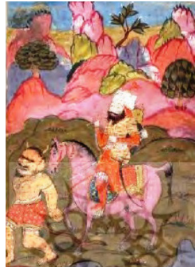
تصویر ۱. اولاد در هیأت دیو نسخه شماره ۳۹۱۶ (ماه‌وان، ۱۳۹۵، ص. ۲۱۵)

تصویر ۲) و در شاهنامه شاه تهماسبی، اولاد در منصب یک راهنما و در شمایل یک انسان پیش‌تر از رستم راه می‌رود (تصویر ۳).