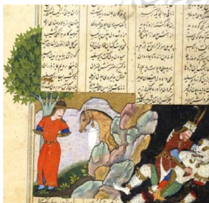
تصویر ۵. نبرد رستم با دیو سفید (نگاره ۱۵، برگ ۷۵ ص)