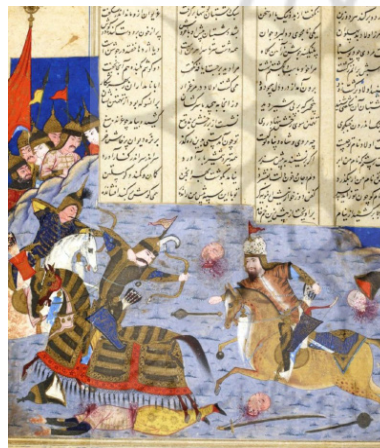
تصویر ۴. نبرد رستم با اولاد (نگاره ۱۲، برگ ۷۳ ص)

شاهنامه ۹۵۳ هـ.ق پاریس مربوط به مکاتب نگارگری تبریز و قزوین عصر صفوی است که در زمان حیات شاه اسماعیل اول و حدود سال ۹۳۰ هـ.ق با مقدمه معروف (بایسنقری) در صفحات ۳۷ تا ۱۴۲ آغاز شد و در زمان شاه تهماسب اول صفوی ادامه و در حدود سال ۹۸۸ هـ.ق نگارش آن پایان یافت (ریشار، ۱۳۸۳، ص. ۱۷۷). شاهنامه مذکور دارای دو روایت است؛ روایت اول در سال ۹۵۰ هـ.ق از ورق ۱۴۷ تا ورق ۵۵۱ و روایت دوم از ورق ۷۵۵ تا ۱۱۵ که با خطی دیگر نوشته شده و در داستان‌های مربوط به افراسیاب و زمان پادشاهی وی ناتمام مانده است. شاهنامه ۹۵۳ هـ.ق پاریس پس از تصرف اصفهان به دست افغانه توسط «ژان لوتر» در ۱۱۵۲ هـ.ق خریداری شده است (ریشار، ۱۳۸۳، ص. ۱۷۷). نسخه مزبور در حال حاضر در کتابخانه ملی پاریس نگهداری می‌شود و دارای ۷۰ نگاره است که دو نگاره از آن، پیکره اولاد را با دو پوشش متفاوت نمایش می‌دهد: یکی در خان پنجم (تصویر ۴) و دیگری در خان هفتم (تصویر ۵).