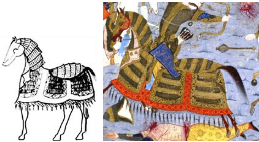
تصویر ۱۲. طرح خطی بلاپوش اسب (نگارنده)

است که قسمت پایین آن عریض‌تر از بالای آن است و این قسمت عریض دارای حاشیه‌ای است. علاوه بر این، نقش یک تَرَنج به صورت نیمه نیز در روی پارچه دیده می‌شود (تصویر ۱۳).