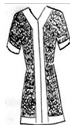
تصویر ۷. تن پوش و خفتان اولاد (نگارنده)