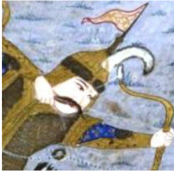
تصویر ۸. کلاه خود اولاد