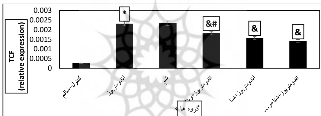
نمودار ۱: بیان ژن TCF برحسب تغییرات GAPDH در گروه‌های مختلف پژوهش.

*: تغییرات معنادار نسبت به گروه کنترل-سالم، &: تغییرات معنادار نسبت به گروه اندومتريوز، #: تغییرات معنادار نسبت به گروه اندومتريوز+شنا+ويتامين D. اختلاف معنی دار در سطح p \leq 0.05 .