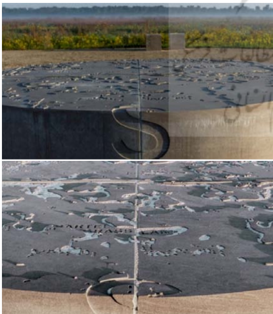
تصویر ۱. ساخته شده از مواد بومی و طبیعی، تغییر فصول و شرایط آب و هوایی تکمیل می‌شود.

فلسفه دیزاین مبتنی بر ایجاد گفتگو بین بازدیدکننده و جهان طبیعی است. رویکرد این پروژه نوآورانه است و تابلوهای فلزی، نیمکت‌های سنگی، میزهای تفسیری و نرده‌های پل را به‌عنوان مجرای داستان‌گویی معرفی می‌کند. این رویکرد نشان می‌دهد که