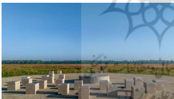
تصویر ۲. نیمکت‌ها با مواد بومی.

دیزاین سازگار با اقلیم که در ساختمان‌های بومی ایرانی دیده می‌شوند-مانند دیوارهای خشتی ضخیم، بادگیرهای شهر یزد، و حیاط‌های سایه‌دار-درک عمیقی از نحوه ایجاد محیط‌های زندگی راحت و پایدار با استفاده از مصالح محلی را نشان می‌دهد. با به‌کارگیری بومی‌گرایی جهانی، این شیوه‌های سنتی را می‌توان با نوآوری‌های مدرن، مانند روش‌های نوین آجرسازی و عایق‌سازی بهتر، تقویت کرد. بومی‌گرایی جهان‌وطنی مانزینی یک چارچوب نظری قوی برای ترکیب مواد بومی مانند گل، خشت و آجر در معماری پایدار مدرن پیشنهاد