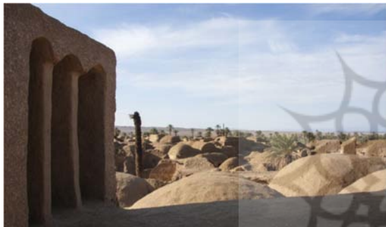
تصویر ۴. پشت بام و بادگیر در اصفهک.

در ایجاد این تزیینات و سازه‌ها در مقایسه با فرآیندهای ساخت‌وساز معاصر حداقل بوده است. کار مرمت اغلب مستلزم درک عمیق تکنیک‌های ساخت‌وساز اصلی است و اطمینان حاصل می‌کند که هرگونه تعمیر یا بازسازی با طرح اصلی مطابقت دارد. با نگهداری و مرمت رباط شرف با استفاده از روش‌های سنتی، کمک مستقیمی به حفظ میراث فرهنگی می‌شود. این رویکرد به اهمیت تاریخی بنا و نقش آن در گذشته منطقه احترام می‌گذارد. این بنا به‌عنوان ارتباط ملموس با گذشته عمل می‌کند و بینش‌هایی را در مورد سبک‌های معماری و تزیینی آن دوران و همچنین زمینه اجتماعی-فرهنگی زمان خود ارائه می‌دهد. رباط شرف، با تزیینات پایدار خود، به‌عنوان یک منبع آموزشی عمل کرده و بینش‌های ارزشمندی