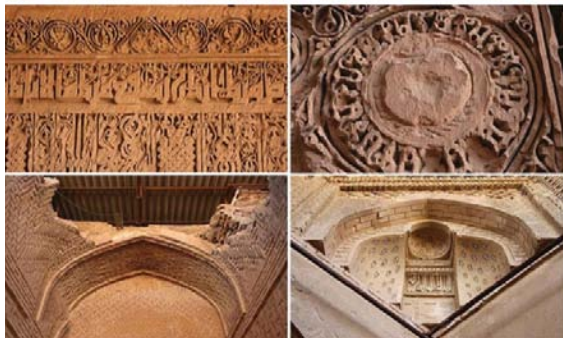
تصویر ۵. تزیینات کاروانسرای رباط شرف.