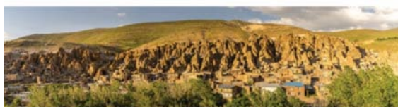
تصویر ۶. روستای کندوان.