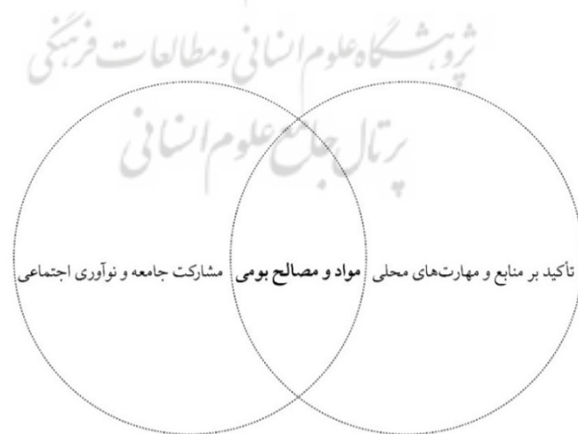
نظریه بومی‌گرایی جهان‌وطنی

از نقطه نظر پایداری، نظریه بومی‌گرایی جهان‌وطنی استفاده از موادی که در بافت جغرافیایی تولید و پردازش می‌شوند را پیشنهاد می‌کند. این امر ردپای کربن مرتبط با حمل و نقل را کاهش داده و تخریب محیطی ناشی از استخراج در مقیاس بزرگ را به حداقل می‌رساند. در زمینه معماری بومی، مصالحی مانند گل و خشت کاملاً با این اصول هماهنگ هستند. این مواد نه تنها در بسیاری از مناطق به راحتی در دسترس هستند، بلکه برای پردازش به حداقل انرژی نیز نیاز دارند. برای مثال، آجرهای گلی اغلب به جای پختن در کوره‌های انرژی، در آفتاب خشک می‌شوند که آن‌ها را به جایگزینی بسیار کم مصرف برای مواد غیربومی مانند بتن و فولاد تبدیل کرده است.