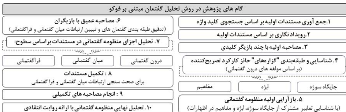
نمودار شماره ۲: گام‌های پژوهش در روش تحلیل گفتمان مبتنی بر فوکو: برگرفته از

بر اساس این مفهوم‌پردازی فوکو، در مطالعه ارتباط قدرت و غیررسمیت شهری قشرفرادست مطالعه گفتمان‌های حقیقت برساخته قدرت از قانون مداری / ناقانون مداری اهمیت می‌یابد (نمودار شماره ۱). تطبیق یا عدم تطبیق توسعه‌های شهری با قانون متأثر از تفاسیر گوناگونی است که از حقیقت قانون مداری صورت می‌گیرد (Edelman & Talesh, 106-105: 2011). قانون دو وجه دارد: چارچوب مکتوب آن و وجه دیگر روح قانون است که به صورت بین‌الذنهانی ساخته شده و ماهیت پویا و سیاسی دارد (Kusiak, 2019: 591). قدرت "قانون نوشته شده" را به عنوان یک معیار مبهم در خدمت خود قرار داده و روح قانون (Kusiak, 2019: 591) را که مبنای تمایزگذاری میان اقدام مشروع و نامشروع در حوزه سیاست‌گذاری شهری است، به صورت گفتمانی شکل می‌دهد. از این رو در منازعات بازیگران قدرت گفتمان‌های حقیقت متفاوتی از قانون مداری / ناقانون مداری ایجاد می‌شود که هر کدام تفسیر خود از معیار حق یعنی قانون را ارائه می‌دهند (Kelling, 2023: 2). در تقابل این گفتمان‌هاست که غیررسمیت از "غیرقانونی بودن" متمایز شده و بر خلاف امور غیرقانونی رسمیت می‌یابد (Bénit-Gbaffou, 2018: 2142). روش تحلیل گفتمان فوکو این "رویه گفتمانی اعمال قانون" (Van Dijk, 1803: 2009) & Beunen و سازوکارهای قدرت پشت آن را واکاوی می‌کند. در بازنگری طرح منطقه ثامن نیز نحوه اعمال قانون حق مکتسبه تبدیل به منازعه میان بازیگران قدرت شده، تعبیر و تفاسیر گوناگونی ارائه می‌شود که هر کدام از آنها قانون مداری / ناقانون مداری مقررات زدایی گسترده در پروژه‌های تجاری اقامتی را به نحو متفاوتی