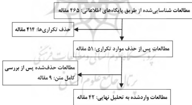
نمودار ۱- فلوجارت غربالگری مطالعات مطابق با دستورالعمل PRISMA

مرحله پنجم، استخراج داده‌ها بود که با استفاده از فرم استاندارد استخراج و براساس اطلاعات کتابشناختی (نویسنده، سال، عنوان)، روش‌شناسی پژوهش و یافته‌های کلیدی مرتبط با شاخص‌های سبک زندگی قرآنی جمع‌آوری شدند. در مرحله ششم، تحلیل داده‌ها (داده‌ها به روش تحلیل محتوای کیفی و با کدگذاری موضوعی بررسی شدند. شاخص‌های تکراری ادغام و فراوانی آنها محاسبه گردید). در مرحله هفتم، ارزیابی کیفیت مطالعات انجام شد؛ که در آن برای کاهش سوگیری، کیفیت مقالات با استفاده از چک‌لیست PRISMA ارزیابی شد. معیارهای ارزیابی شامل واضح بودن سؤال پژوهش، روش‌شناسی مناسب و گزارش‌دهی کامل یافته‌ها بود. مرحله آخر نیز سنتز نتایج بود که در آن، یافته‌ها در دو جدول ارائه شد (جدول ۱: مشخصات و نتایج پژوهش‌های مورد بررسی، و جدول ۲: شاخص‌های سبک زندگی قرآنی و فراوانی آنها). در نمودار (۱) خلاصه این مراحل ارائه شده است.