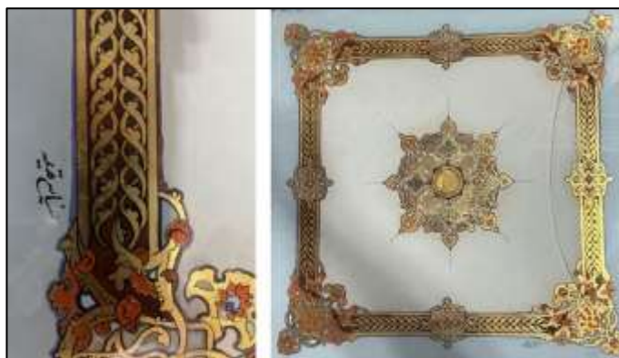
شکل ۷. میز نقاشی پشت شیشه با آرم مدرسه صنایع قدیمه، بخشی از جزئیات اثر و ثبت رقم صنایع قدیمه، اثر حسین طاهرزاده بهزاد، ۱۳۰۹-۱۳۱۰ ه.ش (ابوالفضل عرببیگی، ۱۴۰۳)