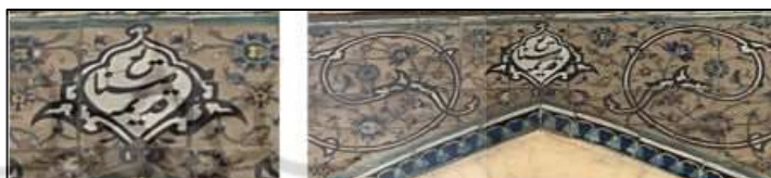
شکل ۸. نام صنایع قدیمه بر بخشی از سردر موزه هنرهای ملی و نمای نزدیک این نشان (ابوالفضل عرببیگی، ۱۴۰۳)