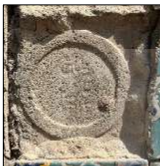
شکل ۹. مشاهده عبارت «صنایع قدیمه» بر ملات پشت کاشی پس از چرخش تصویر در محور افقی (ابوالفضل عرببیگی، ۱۴۰۳)