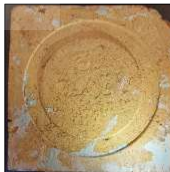
شکل ۱۰. نمای پشت یکی از کاشی‌های تکرنگ کشف‌شده در عمارت مسعودیه (فرشاد مؤذنی، ۱۴۰۳)