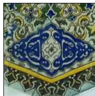
Figure 3. Details of the octagonal tile of the National Museum of Kashan with the repetition of the phrase "Sanāye Ghadimeh"