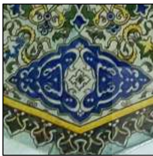
شکل ۳. بخشی از جزئیات کاشی هشت‌گوش با تکرار عبارت «صنایع قدیمه»، محفوظ در موزه ملی کاشان

در مخزن موزه ملی کاشان، آثار سفالین کمتر دیده‌شده‌ای وجود دارند که از آن جمله می‌توان به یک کاشی رومی‌زی با فرم هشت‌گوش به قطر ۵۹ سانتی‌متر و شماره ثبت ۱۵۸۰ اشاره نمود که با استناد به اطلاعات موزه، در شناسنامه اثر، مربوط به دوره قاجار معرفی شده است. این کاشی که دارای نقش مرکزی منظره‌ای متشکل از چندین ساختمان و درخت است، مورد توجه پژوهش حاضر قرار دارد (شکل ۱). در اطراف این نقش مرکزی، شمسه‌ای پرکار به چشم می‌آید که در ردیف بعدازآن، به تناوب از نقش اسلیمی ابری و لچکی‌هایی با زمینه لاجوردی استفاده شده است و برای تکمیل و قاب‌گرفتن نقوش، از یک نوار تزئینی در حاشیه بهره برده‌اند (شکل ۲). این کاشی به شیوه زیرلعابی اجرا شده و از رنگ‌های سفید، سبز، زرد، لاجوردی و قهوه‌ای برای تزئین آن استفاده شده است. نوع بدنه کاشی از جنس خمیرسنگ و پالت رنگ و کیفیت لعاب‌ها نزدیک به نمونه‌های قاجاری است. از سوی دیگر، در لچکی‌های مجاور حاشیه، به‌طور یکی در میان، عبارت «صنایع قدیمه» تکرار شده و فضای درون لچکی را پر کرده است. در فضای حاصل از اتصال این نقوش کنیبه‌ای نیز یک گل چهارپر ترسیم شده است (شکل ۳). پشت این کاشی قالبی، مسطح است و در قسمت‌هایی از آن، شره‌هایی از لعاب شفاف دیده می‌شود. به‌جز ارقام مربوط به ثبت موزه، شامل «پلاک ۴۲۲»، با تردید در خوانش کلمات احتمالی «پلاک ۱۳۳۵» یا «پلاک ۱۳۳۵» و همچنین «سال ۱۸»، نوشته دیگری بر پشت کاشی مشاهده نمی‌شود.