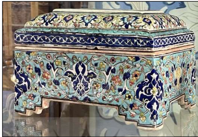
شکل ۱۴. جبهه سفالین درب‌دار، محفوظ در موزه هنرهای ملی، شماره اموال ۱۲۶ (ابوالفضل عرب‌بیگی، ۱۴۰۳)

انواع کاشی تک‌رنگ و هفت‌رنگ، عمده‌ترین محصول تولیدی کارگاه کاشی‌سازی صنایع قدیمه بودند. متأسفانه از جزئیات دقیق این تولیدات تا پیش از سال ۱۳۳۸ ه.ش مطلبی در دست نیست. با استناد به اطلاعات صورت‌مجلس موزه هنرهای ملی، از تولیدات کارگاه کاشی‌سازی مدرسه صنایع قدیمه و بعدها از محصولات اداره هنرهای ملی که در این مکان نگهداری می‌شدند، انواع کاشی هفت‌رنگ، کاشی رومیزی مدور و هشت‌گوش، قاب عکس کاشی، قح، دیس، کاسه، بشقاب، گلدان، و جبهه درب‌دار را می‌توان نام برد. نمونه‌ای از جبهه سفالین درب‌دار با تزئین به شیوه هفت‌رنگی در حال حاضر در موزه هنرهای ملی محفوظ است که می‌توان آن را از نظر شباهت در سبک و شیوه تزئین، با نمونه‌های هفت‌رنگی دارای رقم صنایع قدیمه مقایسه نمود (شکل ۱۴).