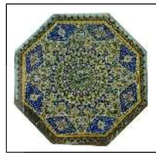
شکل ۱. کاشی رومی‌زی، قطر: ۵۹ و ضخامت: ۲/۷ سانتی‌متر، اثر شماره ۱۵۸۰ موزه ملی کاشان (عباس اکبری، ۱۴۰۳) Figure 1. Tabletop tile, Diameter: 59, Thickness: 2.7 cm, Accession Number: 1580, National Museum of Kashan (Abbas Akbari, 2024)