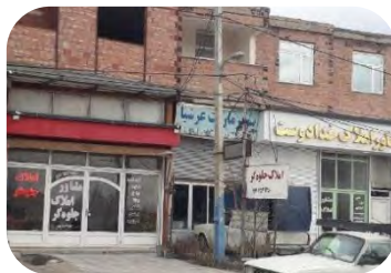
بنگاه های مشاورین املاک در روستای حسن باروق