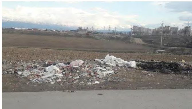
شکل ۵. انتشار نخاله‌های ساختمانی شهری در حاشیه جاده منتهی به روستاهای چندانق و آقبلاغ آقاجان خان