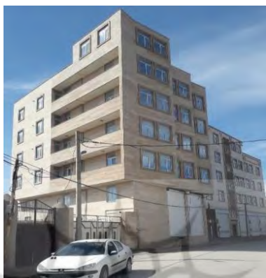
شکل ۱۱. رواج الگوی سکونت شهری (آپارتمان‌های بلندمرتبه) در روستای سلطان‌آباد

دلایل متعدد نه تنها نتوانسته‌اند به بیشتر اهداف خود دست یابند و تنها درصد اندکی از این برنامه‌ها و طرح‌ها تحقق یافته است، بلکه با برجای گذاشتن اثرات و پیامدهای منفی، موجبات نارضایتی و بدبینی روستائیان را فراهم نموده‌اند که دلایل ریشه‌ای آن‌را می‌توان در ارتباط با مواردی چون «نگرش تک بُعدی (کالبدی)، عدم توجه به توسعه یکپارچه شهری- روستایی، بهره‌گیری از شرح خدمات همسان (یکسان نگری)، عدم مشارکت (عدم اجتماع محوری)، استفاده از الگوی شهری در تهیه طرح، عدم انعطاف‌پذیری، عدم آینده‌نگری و عدم آسیب‌شناسی و ضعف نظام پایش و ارزیابی» این طرح‌ها مورد توجه قرار داد.