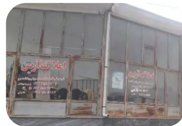
بنگاه مشاور املاک در روستای بنفشه درق

شکل ۸. دلالی و واسطه‌گری (بنگاه‌های مشاور املاک) در روستاهای پیراشهری اردبیل