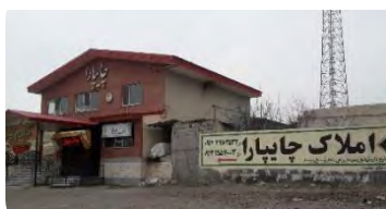
مشاغل خدماتی (بنگاه املاک و رستوران داری) در روستای قاسم قشلاقی