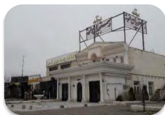
واحدهای پذیرایی روستای قاسم قشلاقی

مرتبط با حمل و نقل (کامیون داری و تاکسیرانی) را فراهم نموده به نحوی که کامیون داری در روستاهای سلطان آباد، کرکوک و حمل آباد بسیار با اقبال مواجه شده بطوری که عمده درآمد اهالی روستای سلطان آباد با در اختیار داشتن حدود ۳۰۰ دستگاه ولو و تریلی، از این راه تأمین می شود. در هر یک از روستاهای آقباقر و انزاب علیا نیز بیش از ۵۰ دستگاه تاکسی وجود دارد که روزانه در شهر اردبیل مسافرکشی نموده و در ساعات پایانی روز به روستا برمی گردند. اشتغال در ادارات و کارگری در صنعت ساختمان سازی و کار در کارگاه های شهر اردبیل، دیگر مشاغل خدماتی روستائیان را تشکیل می دهند (شکل ۶).