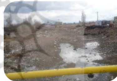
آلودگی های زیست محیطی ناشی از انتشار زباله های شهری در اراضی زراعی روستای گیلانده