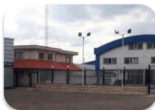
مشاغل خدماتی روستای گیلانده