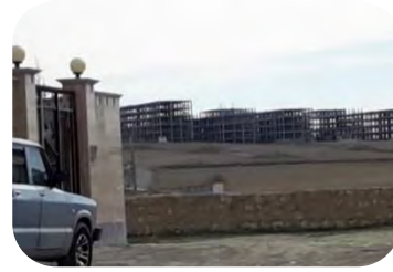
مسکن مهر اردبیل در اراضی بلافصل روستای شام اسبی