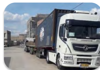
کامیون داری در روستای سلطان آباد