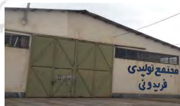
شکل ۷. صنایع کارگاهی روستای کمی آباد