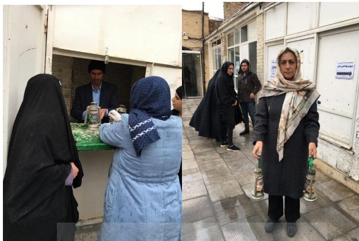
تصاویر ۲ و ۳: آیین چراغ‌بران، نوروز ۱۴۰۳، منبع: نگارنده