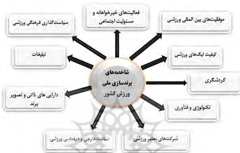
شکل ۱: مدل مفهومی پژوهش