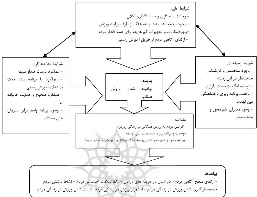
شکل ۲. مدل نهایی مطلوب نهادینه کردن ورزش همگانی

آموزشی، عملکرد صحیح و آگاهانه خانواده‌ها و وجود برنامه‌ای واحد و مدون برای سازمان‌های مختلف و شرایط زمینه‌ای که شامل: وجود متخصص و کارشناس صاحب نظر در زمینه ورزش همگانی، توسعه امکانات سخت‌افزاری در فضاهای عمومی، وحدت برنامه‌ریزی و هماهنگی بین نهادهای و وجود مدیران و کارشناسان علم محور و متخصص طبقه‌بندی می‌شوند. شرایط مذکور به طور کلی و در امتداد یکدیگر باعث بروز پدیده‌ای به نام نهادینه کردن ورزش همگانی می‌شود. گرایش افراد در کشور به