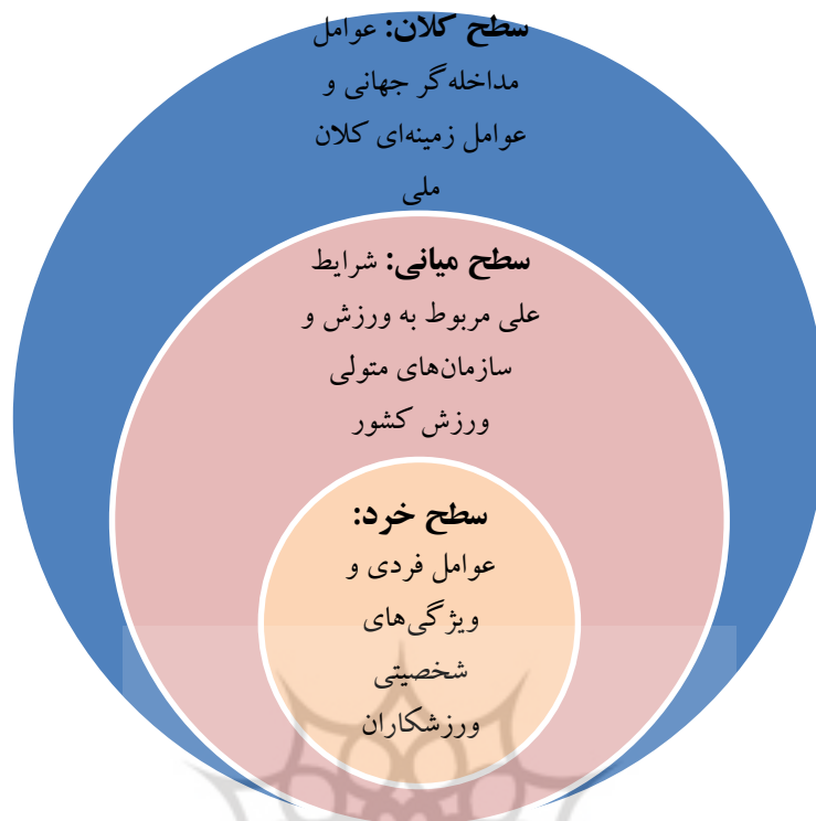
شکل شماره (۲). عوامل مؤثر بر گرایش به مهاجرت ورزشکاران نخبه

ارائه تصویری اجمالی از عوامل مؤثر بر گرایش به مهاجرت ورزشکاران نخبه بود.