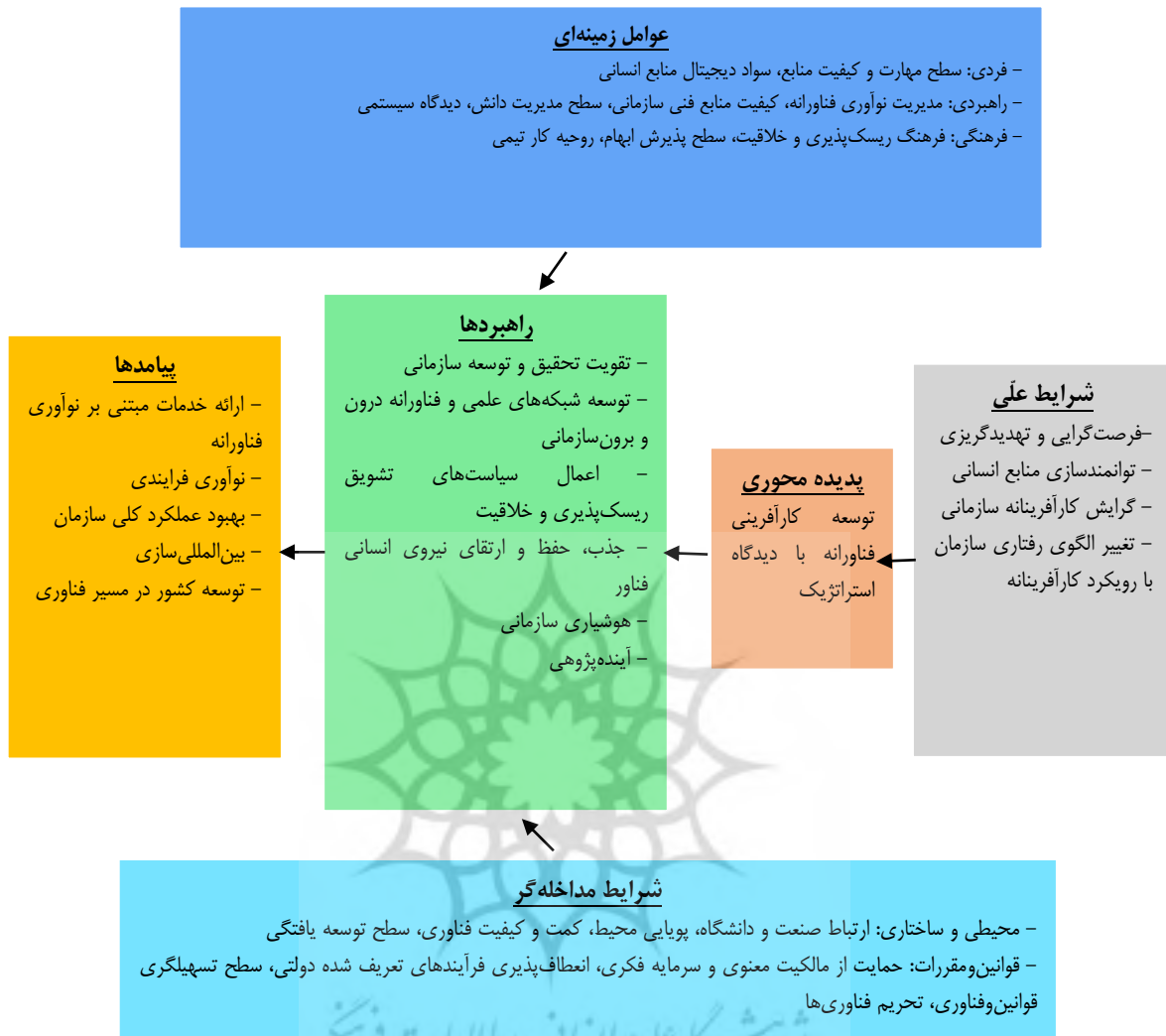
شکل ۱. مدل توسعه کارآفرینی فناورانه با رویکرد استراتژیک