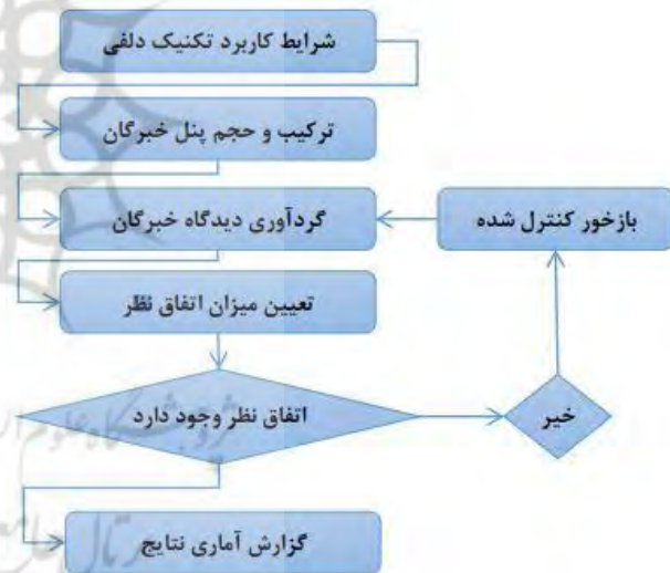
شکل ۱: چارچوب نظری پژوهش دلفی

مانند همه روش‌ها، مطالعه دلفی نیز محدودیت‌هایی را به همراه دارد. نتایج به‌شدت به تخصص و دیدگاه‌های پانل انتخاب شده وابسته هستند. ممکن است تعصبات جغرافیایی یا فرهنگی وابسته به پیشینه شرکت کنندگان وجود داشته باشد. همچنین ماهیت پویا و به‌سرعت در حال تحول وب ۳ می‌تواند منجر به منسوخ شدن سریع برخی از بینش‌ها در آینده شود. در مجموع، روش دلفی به‌دلیل استحکام آن در بدست آوردن اجماع در زمینه‌هایی که با عدم قطعیت و شواهد تجربی محدود مواجه هستند، روشی مطلوب است. درنهایت، طرح کلی مطالعه دلفی را مانند شکل شماره ۱ می‌توان توصیف کرد: