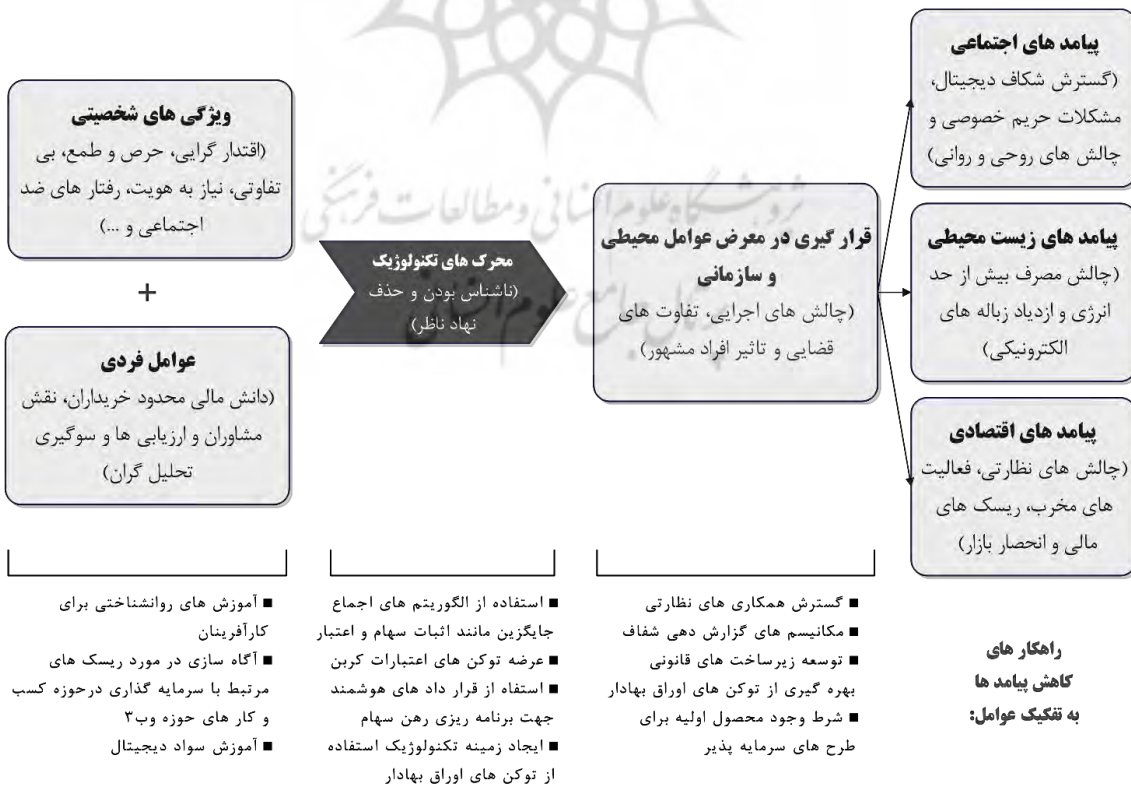
شکل ۲: طرح مفهومی پژوهش

در نظر بگیرند. همچنین، خود جامعه وب ۳ که به‌طور اساسی