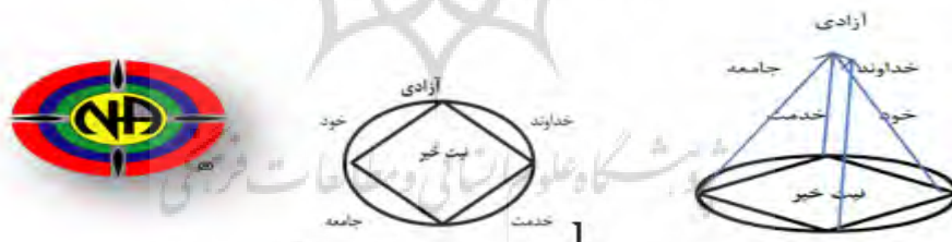
شکل (۱): نمادهای انجمن معتادان گمنام

تحلیل محتوای برنامه‌ها و روش‌های ترک اعتیاد در انجمن معتادان گمنام انجمن معتادان گمنام در راستای حفظ روحیه اتحاد و همبستگی اعضای خود، دارای نمادی است که پیوند دهنده اعضا و بیانگر هدف آنهاست که به شکل زیر است: