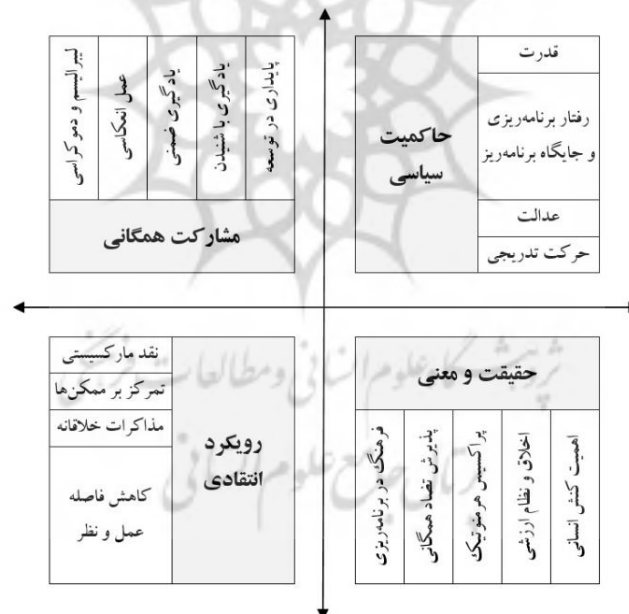
شکل ۱. طبقه‌بندی مفاهیم پرتکرار در برنامه‌ریزی شهری عمل‌گرا (پراگماتیستی)

پژوهش حاضر مبتنی بر پارادایم فلسفی پراگماتیسم و در چارچوب روش کیفی صورت‌بندی شده است؛ روش کیفی اساساً در جستجوی «مفاهیم» است (Mohajan, 2018). بر این اساس مرور منابع و پیشینه پژوهش با رویکرد جستجوی مفاهیم، در بین 25 اثر پژوهشی که مشخصاً ارتباط میان شهرداری و فلسفه پراگماتیسم را محور کار خود قرار داده‌اند، انجام شده است. مفاهیم شناسایی شده شامل: قدرت (Hoch, 1984-a)، لیبرالیسم و دموکراسی (Talisse & Aikin, 2008)، رویکرد انتقادی و نقد مارکسیستی (Bridge, 2014 & Forester, 2017 & Forester, 2012)، اخلاق و نظام ارزشی جامعه (Furlong et al., 2017)، بازساخت امور ممکن ۲ به‌جای تمرکز بر ناممکن‌ها (Holden & Scerri, 2015)، حرکت تدریجی (Hoch, 2017)، پذیرش تضاد عمومی (Meck, 1991)، انعطاف‌پذیری و پیشروی بر اساس بازخوردهای دریافتی یا «عمل تأملی- انعکاسی» ۳ (Schön, 1982)، آموزش و یادگیری ضمنی (Schön, 2017)، یادگیری با شنیدن ۴ (Jon, 2020)، پراکسیس هرمنوتیک ۵ (اثر متقابل فهم و کنش) یا کاربرد عملی اصول هرمنوتیک در تفسیر و فهم پدیده‌ها (Verma, 1996)، عدالت و مقابله با تبعیض (Hoch, 2016 & Dorstewitz, 2008)، مذاکرات خلاقانه ۶ در برنامه‌ریزی شهری (Forester, 2013)، جایگاه فرهنگ در عمل برنامه‌ریزی (هیلی، ۲۰۰۹)، رفتار برنامه‌ریزی (Hall, 2014)، پایداری توسعه (Batty, 2006)، اهمیت کنش انسانی (Hoch, 2007) و پرکردن فاصله میان عمل و نظر (Hoch, 1984-b) که مجموع این ۱۸ مفهوم در ۴ دسته: «حاکمیت سیاسی»، «رویکرد انتقادی»، «جستجوی حقیقت و معنا» و «مشارکت» مطابق نمودار زیر و برای کاربرد در ادامه پژوهش گروه‌بندی شده‌اند.