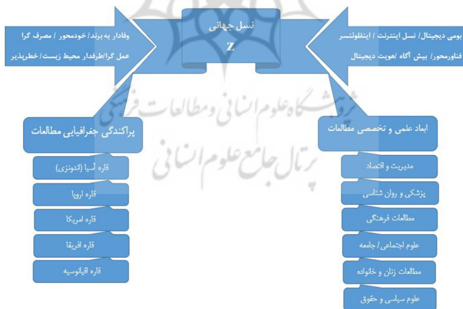
شکل (۳). مدل مفهومی تحقیق، حاصل از تحلیل مطالعات نسل زد جهانی