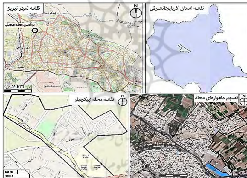
شکل ۲. موقعیت جغرافیایی محله ایپکچیلر در شهر تبریز (ترسیم: نگارندگان)

محله ایپکچیلر در جهت شمال غرب شهر تبریز و در مختصات جغرافیایی 38^{\circ}11' عرض شمالی واقع است. این محله از نظر تقسیمات اداری و خدماتی در حوزه عملکردی شهرداری منطقه ۴ و در محور بزرگراه آذربایجان- سرداران فاتح، خیابان شهیدان ذاکر و بالاتر از میدان معلم در قلمرو زمین‌های محله تاریخی حکم‌آباد شکل گرفته است. طبق سرشماری ۱۳۹۵ منطقه ۴ بالغ بر ۳۱۶۱۲۶ نفر و محله ایپکچیلر ۸۱۷ نفر جمعیت را در خود جای داده‌اند. قسمت اعظم منطقه ۴ تبریز را بافت‌های قدیمی، فرسوده و مسئله‌دار تشکیل می‌دهند و ساختار کالبدی و شبکه ارتباطی به دلیل داشتن معابر تنگ و کوچه‌های بسیار باریک از نفوذپذیری سختی برخوردار است (شکل ۲).