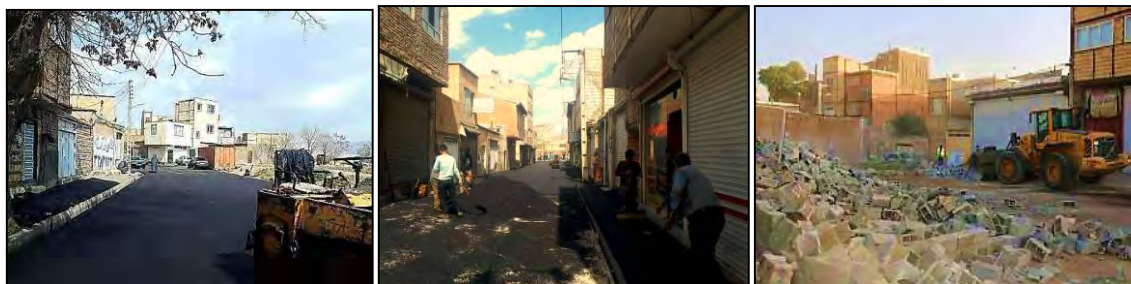
شکل ۳. نمایی از وضعیت محله در مرحله توانمندسازی از نظر دسترسی و نفوذپذیری