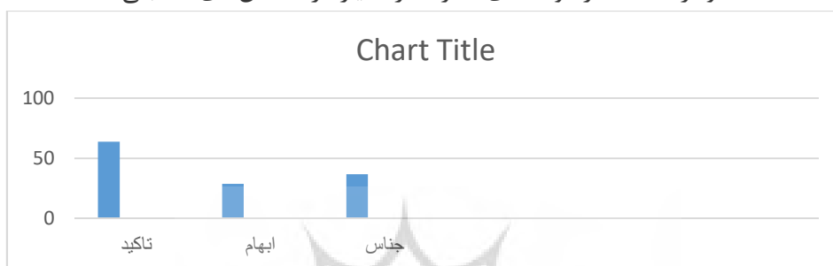
نمودار استفاده از مؤلفه‌های انحراف از معیار در داستان‌های تنکابنی

در خصوص کاربرد مؤلفه‌های انحراف از معیار در داستان‌های تنکابنی، کاربرد تأکید آوایی، بیش‌ترین بسامد و ابهام در واژگان، کمترین بسامد را دارد.