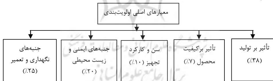
شکل ۲: معیارهای اصلی اولویت‌بندی تجهیزها از نظر بحرانی بودن

در RCM که هر چه بحرانی بودن تجهیزها بیشتر باشد، باید نگهداری از آنها به سمت نت پیشگیرانه برود و هر چه بحرانی بودن کمتر باشد، به سمت نت اضطراری و بدون نیاز به پیشگیری خواهد رفت؛ البته آنالیز RCM که در مورد خرابی‌ها و اثرات آنها بحث می‌کند، به بحرانی بودن خود تجهیز از این منظر نمی‌نگرد ولی برای اینکه مشخص شود برای کدام تجهیزها بهتر است، ابتدا پیاده‌سازی روش شناسی RCM انجام شود، معیارهایی برای تعیین بحرانی بودن تجهیزها به صورت زیر تعیین می‌شود که خروجی آنها مشخص می‌کند، اولویت انجام تحقیق برای کدام تجهیز بیشتر است. بدین منظور معیارهای پنج‌گانه‌ای به شرح "شکل ۲" در نظر گرفته شده و با توجه به کم بودن تعداد معیارها، اهمیت آنها با کمک روش وزن‌دهی مستقیم خبرگان (جهان و همکاران ۱ ، ۲۰۱۲) به دست آمده است. خبرگان از شاغلان در سیستم تقلیل فشار شرکت گاز شهرهای دماوند و تهران انتخاب شدند.