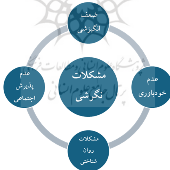
شکل شماره ۲: مضامین اصلی مشکلات و چالش‌های نگرشی

حاصل عواملی مانند مشوق‌ها، نیازهای درونی، کنجکاوی، برانگیختگی و علت‌هایی می‌دانند که فرد برای رویدادها و نتایج اعمال می‌کند. در این باره مشارکت‌کننده (۴) بیان کرد: «گاهی با رفتارهای عصبی مانند جیغ کشیدن دانش‌آموزان مواجهیم». کودک بیمار از نظر نیاز درونی احساس نیازی ضروری به یادگیری ندارد و کمترین مشوقی می‌تواند این کودک را به یادگیری تشویق نماید. این کودکان بنا به تفاوتی که بین خود و همسالانشان احساس می‌کنند ضعف در خودباوری دارند و به‌طور کلی نگرش منفی در مورد ارزشمندی خود، ارزیابی منفی از کیفیت‌ها و مهارت‌های خود، فقدان همگرایی بین خودارزیابی‌ها و شاخص‌های عینی عملکرد، احساس منفی نسبت به خود و خودانگاره منفی دارند. این عوامل سبب می‌شود که خودباوری پایینی داشته باشند این کودکان احساس تنهایی خاصی دارند. ترس از مستقل شدن دارند و به‌شدت به خانواده خود وابسته‌اند که این عوامل بر میزان پذیرش اجتماعی آن‌ها تأثیر زیادی دارد. در این زمینه مشارکت‌کننده شماره (۹) بیان کرد «بچه من هیچی اش نیست» که در واقع عدم پذیرش بیماری از طرف خانواده است.