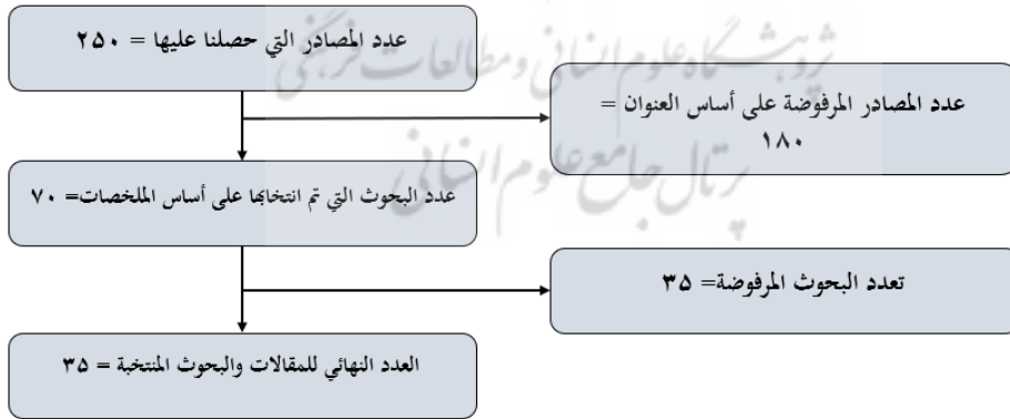
الشكل رقم ٢: عملية اختيار المقالات

لاختيار الدراسات المناسبة بناءً على العملية المذكورة في الشكل ٢، تم النظر في معايير مثل العنوان والملخص والمحتوى وطريقة البحث.