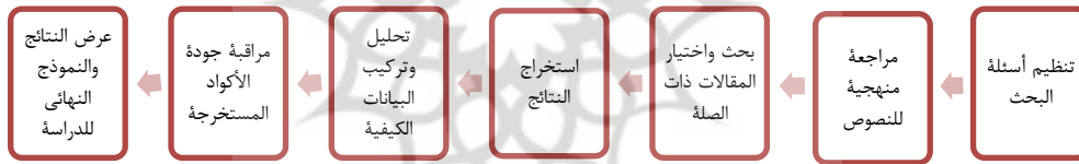
الشكل رقم ١: المراحل السبع للتجميع التلوي لمنهج سندولوسكي و باروسو (٢٠٠٦)

تسعى الدراسة الحالية إلى تحديد فجوات الدراسات السابقة باستخدام طريقة التجميع التلوي. وعليه فإن البيانات والمصادر في هذه الدراسة هي بيانات ثانوية. وفقاً لذلك، قامت الدراسة الحالية بمراجعة وتحليل المقالات المختارة بشكل منهجي بناءً على استراتيجية المركب التلوي. من حيث الغرض، يعد البحث الراهن بحثاً نوعياً (وصفي - توضيحي) تم إجراؤه بمنطق استقرائي من خلال مراجعة منهجية للدراسات الحالية (كمالي، ١٣٩٦: ٧٢٥). في البحث الراهن استخدمنا كذلك منهج التلوي لسندولوسكي وباروسو ٢ (٢٠٠٦: ٢٩)، والذي يشمل سبعة مراحل: