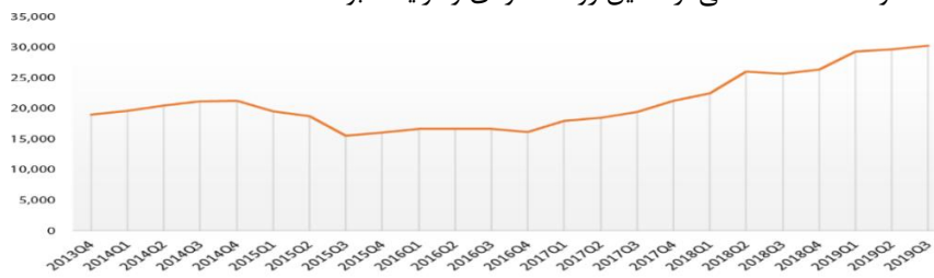
نمودار شماره (۱): روند استفاده از صکوک در فعالیتهای تجاری طبق داده های پایگاه هیئت خدمات مالی اسلامی

جهانی طی سال‌های اخیر طبق داده های پایگاه هیئت خدمات مالی اسلامی را نمایش می‌دهد. همانگونه که مشاهده می‌گردد این روند صعودی و فزاینده بوده است.