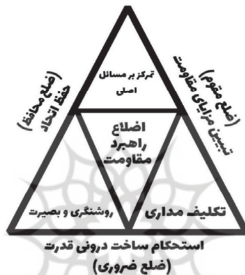
شکل شماره ۳: طراحی الگوی عملیاتی سازی راهبرد مقاومت

مؤلفه بصیرت که در علت ضروری با مؤلفه استحکام ساخت درونی و در علت محافظ با مؤلفه حفظ اتحاد مشترک است در زاویه سمت چپ قرار گرفته است تا مفهوم اشتراک دو مؤلفه را انتقال دهد. همچنین مؤلفه اصالت تکلیف چنین نقشی را در زاویه سمت راست برای دو ضلع ضروری و مقوم ایفا می‌کند.