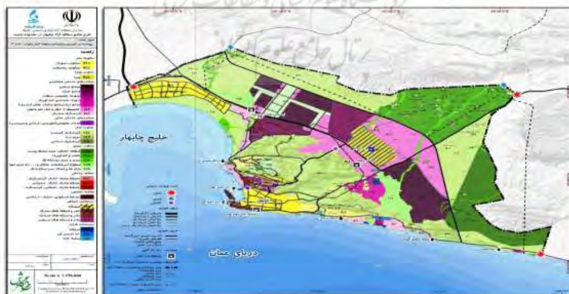
شکل ۳- پهنه بندی منطقه آزاد چابهار

چون هدف این تحقیق بررسی توسعه اقتصادی صنعت گردشگری مناطق آزاد ایران با در نظر گرفتن ابعاد جغرافیایی است، توسعه دانش راجع به آن و ارائه مدل در این حوزه است، پارادایم مورد استفاده در این تحقیق از نوع تفسیر گرایی می‌باشد. این تحقیق از نوع پژوهش کاربردی است چرا که به قصد کاربرد عملی دانش و کاربرد نتایج یافته‌ها برای پاسخگویی به سؤالات مطرح شده در نمونه تحقیق انجام می‌شود. چون در این پژوهش با استفاده از معلومات جزئی و برقراری ارتباط بین آنها حکم کلی استنتاج می‌شود و مشاهده‌ها بر رویدادهای مشخصی در نمونه‌های ذکر شده در منطقه آزاد چابهار صورت می‌گیرد و سپس بر اساس مشاهده حوادث یا رویدادها، استنباط در مورد گردشگری مناطق آزاد ایران انجام می‌شود، رویکرد پژوهش از نوع استقرایی می‌باشد یعنی رسیدن از جزء به کل. پهنه بندی منطقه مورد بررسی در شکل ۳ مشخص شده است.