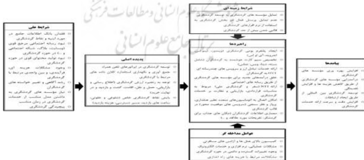
شکل ۴- مدل نظری "توسعه اقتصادی صنعت گردشگری مناطق آزاد ایران با در نظر گرفتن ابعاد جغرافیایی"

رویه تحلیل داده‌ها منجر به خلق مدل نظری گردید و شامل شرایط علی، شرایط زمینه‌ای، شرایط مداخله گر، راهبردها و پیامدها هستند که پدیده اصلی یعنی "توسعه اقتصادی صنعت گردشگری مناطق آزاد ایران با در نظر گرفتن ابعاد جغرافیایی" را تشریح می‌کنند. این مدل مطابق با ابعاد مدل پارادایمی در شکل ۳ نشان داده شده است.