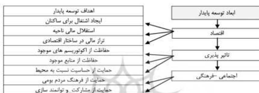
شکل ۱- ابعاد و اهداف توسعه پایدار گردشگری (صالح‌پور و همکاران، ۱۳۹۸)

که بخشی از الگوی نوسازی به حساب می‌آید. در همین ارتباط، این باور وجود دارد که گردشگری ارز خارجی و مشاغل را افزایش می‌دهد و هزینه‌های گردشگری با اثراتی چندبرابری، تحریک اقتصاد محلی را به همراه دارد (اکبریان رونیزی، ۱۳۹۴). گردشگری امروزه نقش قابل توجهی را در توسعه اقتصادی نواحی مختلف داشته و علاوه بر جنبه اقتصادی، این صنعت می‌تواند تغییرات فرهنگی و اجتماعی مهمی را در مقصد ایجاد کند و از طریق توزیع درآمد، اشتغال زایی و کاهش فقر باعث توسعه و پیشرفت اجتماعی شده، رفاه و سلامت عمومی را ایجاد نماید. رویکرد زیربنایی که هم اکنون در برنامه ریزی گردشگری و در سایر انواع توسعه به کار می‌رود، رویکرد رسیدن به توسعه پایدار است. براساس روش توسعه پایدار، منابع طبیعی، فرهنگی و سایر منابع گردشگری برای استفاده مداوم در آینده، باید حفظ شوند و در عین حال، برای جامعه کنونی سودمند و مفید باشند. بنابراین برنامه ریزی گردشگری مستلزم تدوین اصولی است که توسعه پایدار گردشگری بر مبنای آن‌ها بنا نهاده شوند (تقوایی و صفرآبادی، ۱۴۰۰). شکل ۱ ابعاد و اهداف توسعه پایدار گردشگری را نشان می‌دهد.