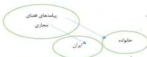
شکل ۱- مدل مفهومی ارتباط فضای مجازی با خانواده در ایران

پیامدهای فضای مجازی در حوزه خانواده در ایران قابل بررسی هستند. - پیامدهای فضای مجازی در حوزه خانواده قابل بررسی هستند. پیامدهای فضای مجازی در ایران قابل بررسی هستند. - پیامدهای فضای مجازی در ایران قابل بررسی هستند. مدل مفهومی پژوهش حاضر در شکل ۱ ارائه شده است.