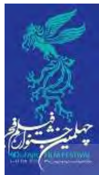
امروزه نقش سیمرغ به‌عنوان نماد جشنواره فجر روی پارچه خودنمایی می‌کند