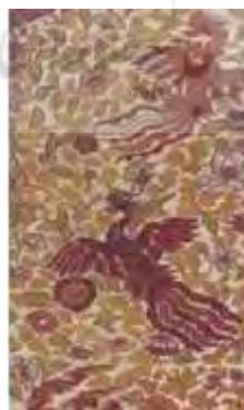
قرن ۷ هجری- ابریشم و نخ طلایی- رنگ طلایی و قرمز