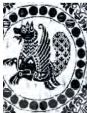
قرن ۴ هجری-روم شرقی به سبک ایرانی