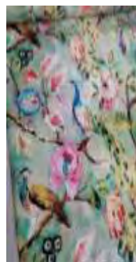
نقش طاووس بر روی پارچه‌های معاصر توجه به رنگ پردازی