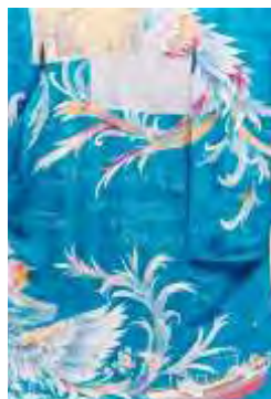
پارچه‌ی ابریشم با نقش سیمرغ معاصر

نقوش حیوانات بر پارچه‌ها با مضامین مذهبی و اساطیری باشکوه و زیبایی به همراه بوده است. نقوش بر پارچه‌ها، کفن‌ها، طاقه‌های پارچه با نوشته‌های تدفینی و دینی منطبق با اعتقادات آل بویه برای پوشش قبر استفاده می‌شده است. نقوش حیوانات در صحنه‌های شکار و طرح ساده حیوانات و گاهاً با خطاطی مزین می‌شدند. (زکی، ۱۳۶۳: ۱۹۰).