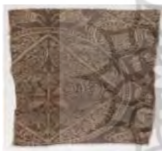
آل بویه- پارچه پشم و ابریشم-ری مربع، دایره، طاووس، گربه شیردال، درخت نخل، کتیبه برای اجرای مراسم تدفین

نقش خروس در پارچه، آثار سفال و فلز دیده‌شده است. خروس نماد گستره روح به‌ویژه پس از مرگ است. به تعبیر دیگر نشانه خروس به معنای علامت رسمیت است (موسوی و آیت‌اللهی، ۱۳۹۰: ۵۴). تصویر سمت چپ خروس به‌صورت نیم‌رخ اما دو پا روی زمین همراه با تزیینات هندسی، هاله دور سر نمودی از خورشید و جنبه تقدس برای فراخواندن سحر دیده می‌شود و قاب دایره‌ای شکل با تزیینات به ترکیب‌بندی کمک کرده است. استفاده از رنگ قرمز جذابیت بیشتری به پارچه بخشیده است.