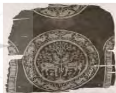
پارچه ابریشمی قرن ۴ هجری-ری حیوانی- گیاهی-هندسی-