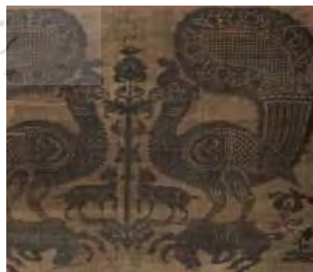
نقش طاووس- پارچه ساسانی- با اندکی تغییر در عصر آل بویه ادامه پیدا کرد. این نقش به‌صورت قرینه و واقع‌گرایانه تصویر می‌شده است. -همراه درخت زندگی- کاربرد: پوشش قبر