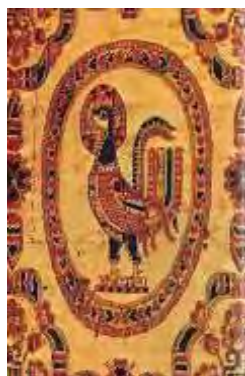
نقش خروس شبیه به نقش طاووس- پارچه ساسانی- سه رنگ اصلی: زرد قرمز و آبی

نقش سیمرغ در نمونه‌های اوایل اسلامی به‌صورت نیم‌رخ مشاهده می‌شود. از حالت پاها در حال حرکت بودن را تداعی می‌کند. به‌صورت کلی برگرفته از موجودات ترکیبی است با طرح‌های هندسی آذین شده است.