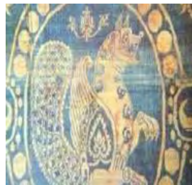
پارچه‌ی ابریشم مربوط به اوایل اسلام در ایران یا ماوراءالنهر

نقش سیمرغ در تمدن شرقی مظهر نیرومندی، شجاعت و نشان قدرت شاهی، نماد عظمت، نگهبان که قدرت او باعث دور شدن تأثیرات زیان‌آور و دارای ارزش والایی است. از جمله نقوشی است که تا به امروز تغییر شکل و کاربرد متنوعی از جمله در کاشی‌کاری، سردر بناها، فرش، نگارگری و دیگر منسوجات داشته است.