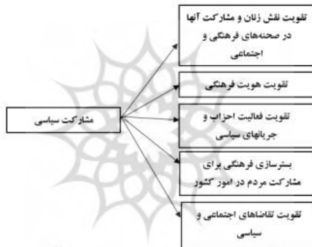
شکل ۱. مدل مفهومی پژوهش (ترسیم از نگارندگان)

شفاف‌تر طی می‌شود (۷) مشارکت سیاسی می‌تواند به تقویت شایسته‌سالاری در انتخابات و فرایندهای سیاسی کمک کند. با شرکت فعال شهروندان در انتخابات، افرادی که به مناصب و مسئولیت‌های سیاسی دست می‌یابند، از طریق رأی‌گیری و با توجه به عملکرد و کفایت خود، مورد ارزیابی قرار می‌گیرند که این امر می‌تواند به تقویت شایسته‌سالاری در سیستم سیاسی کمک کند و به انتخاب نمایندگان و مقامات مجرب و شایسته منجر شود. (۸) مشارکت سیاسی می‌تواند به توسعه فرهنگ سیاسی در جامعه کمک کند. با شرکت فعال شهروندان در فرایندهای سیاسی، آگاهی و شناخت افراد نسبت به سیستم سیاسی و فرایندهای آن افزایش می‌یابد. این امر می‌تواند به تقویت آگاهی سیاسی و مشارکت شهروندان در تصمیم‌گیری‌های سیاسی منجر شود. (۹) مشارکت سیاسی می‌تواند به سازماندهی قدرت مردمی کمک کند. با شرکت فعال شهروندان در فرایندهای سیاسی، قدرت و تأثیر مردم در تصمیم‌گیری‌ها و اجرای سیاست‌ها افزایش می‌یابد و می‌تواند به تقویت قدرت مردمی و کاهش تمرکز قدرت در دستگاه‌های اجرایی و مجری منجر شود. همچنین (۱۰) مشارکت سیاسی می‌تواند به ارتقای مشارکت زنان در فرایندهای سیاسی کمک کند. با فعال شدن زنان در انتخابات و سایر فرایندهای سیاسی، نقش زنان در تصمیم‌گیری‌های سیاسی تقویت می‌شود و این امر می‌تواند به تعادل جنسیتی و تمثیل مناسب زنان در نهادهای سیاسی و اجرای سیاست‌ها منجر شود. با توجه به مطالب گفته شده و بررسی آرای صاحب‌نظران و مطالعه کتب و مقالات معتبر، در ادامه تلاش شده است مشارکت سیاسی در جمهوری اسلامی ایران در مجموع در قالب پنج کارکرد اصلی به شرح مدل مفهومی ذیل مورد بررسی قرار گیرد.