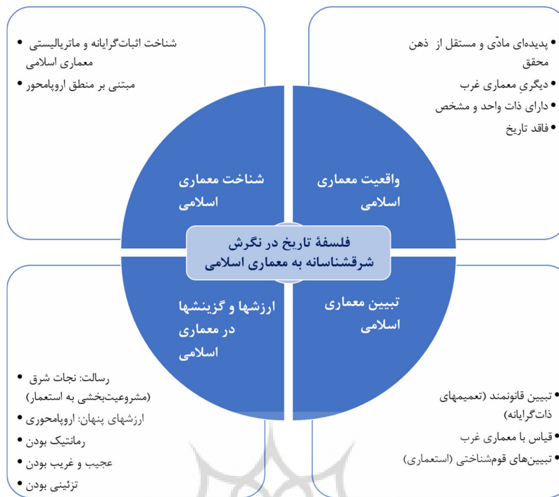
شکل ۲. فلسفه تاریخ در نگرش شرق شناسانه به معماری اسلامی و مولفه های آن

است. همچنین هنر و معماری اسلامی با رویکردی قوم‌شناسانه تبیین می‌شود (شکل شماره ۲).