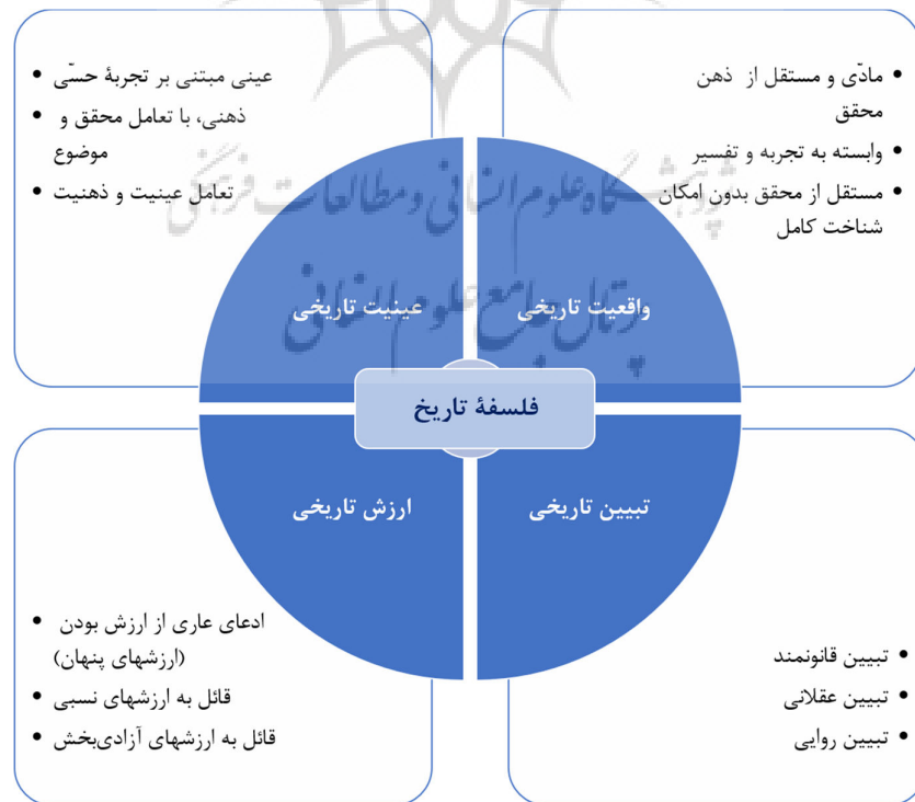
شکل ۱. مؤلفه‌های اساسی فلسفه تاریخ و امکان‌های مختلف در هر یک

در تاریخ سه نوع کلی تبیین معرفی شده است: تبیین قانونمند (برداشت قانونمند از تبیین تاریخی): (پوپر و همپل) فلاسفه پوزیتیویست که تاریخ را نوعی علم پوزیتیویستی می‌دانند، تبیین‌های مبتنی بر قانون را اصلی‌ترین نوع تبیین می‌دانند. در این تبیین واقعه مورد نظر به‌عنوان جزئی از جریان کلی تعمیم‌بخش توضیح داده می‌شود. تبیین عقلانی (برداشت عقلانی از تبیین تاریخی) (کالینگود) متأثر از تفاوت بین تاریخ و علوم، اعمال را با توجه به خواسته‌ها، اعتقادات، نیات، معیارها و به‌طور کلی با توجه به علل و دلایل آن‌ها تبیین