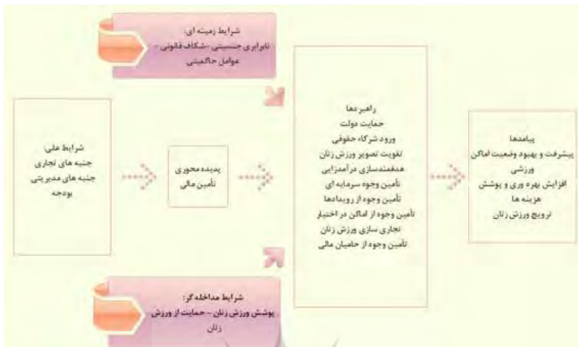
شکل ۱. مدل پارادایمی تأمین مالی ورزش‌های سودمحور

بر اساس نتایج برخاسته از داده‌ها تأمین مالی ورزش‌های سودمحور با تأکید بر ورزش زنان تحت تأثیر شرایط علی است. در واقع شرایط علی به صورت مستقیم در تأمین مالی نقش دارند. در کنار این شرایط می‌توان گفت تأمین مالی تحت تأثیر شرایط زمینه‌ای و مداخله‌گر نیز قرار دارد؛ به این معنی که نابرابری جنسیتی، شکاف قانونی و عوامل حاکمیتی که در قالب شرایط زمینه‌ای مطرح شده‌اند و پوشش ورزش زنان و حمایت از ورزش زنان که جزء شرایط مداخله‌گرند، از طریق اثرگذاری بر کنش‌ها/ راهبردها تأمین مالی را دستخوش تغییر می‌کنند. به موازات آن اگر راهبردها به کار گرفته شود، احتمال است پیشرفت و بهبود وضعیت اماکن ورزشی، افزایش بهره‌وری و پوشش هزینه‌ها و ترویج ورزش زنان به عنوان نتیجه و پیامد تأمین مالی پدیدار شود. سرانجام بر اساس مدل مرحله قبل، گزاره‌ها و توضیحاتی که ارائه شد در شکل ۲ طبقات مدل با یکدیگر مرتبط شد و در نهایت مطابق شکل ۲ مدل تأمین مالی ورزش‌های سودمحور با تأکید بر ورزش زنان ارائه شد.