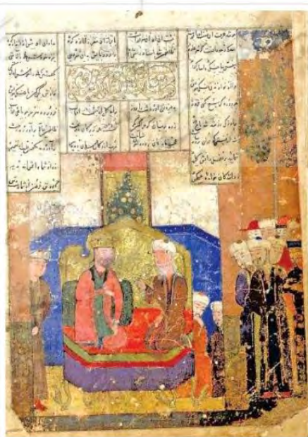
تصویر ۱. اسکندرنامه ابراهیم‌میرزا. مکتب شیراز. محل نگهداری: کتابخانه مجلس شورای اسلامی

نظامی نه تنها مبارزات حق طلبانه در راه کسب آزادی را تقدیر می‌کند بلکه در عین حال آن‌ها را یک وظیفه شریف می‌داند. جنگ اسکندر با دارا، شاه ایران، مانند چنین مبارزه‌ای تصویر می‌شود. نظامی علت این جنگ را این گونه توجیه می‌کند که در زمان فیلیپ پادشاه رعیت‌نواز و صلح‌پرور و عادل، دارا با تهدید یونانیان به حمله به کشورشان، آنان را وادار به پرداخت خراج کرد. اسکندر پرداخت این خراج را برای خود و کشورش، مایه خفت می‌شمرد و می‌خواست از این کار سرباز زند. تصویر شماره ۱، نگاره‌ای از اسکندر در اسکندرنامه را ترسیم کرده است.