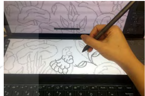
تصویر ۴. طراحی نقشه فرش بر روی صفحه دیجیتال. منبع: نگارندگان.

۳. فرآیند طراحی دیجیتال فرش: در این شیوه، عناصر فیزیکی مانند کاغذ، مداد و پاک‌کن به‌طور کامل حذف می‌شود و از ابزارهای ترسیم دیجیتال و نرم‌افزارهای مبتنی بر آن‌ها به‌صورت مستقیم استفاده می‌گردد. طراح تمام مراحل طراحی را با قلم نوری بر روی صفحه دیجیتال اجرا می‌کند. انواع سخت‌افزارهایی که قابلیت استفاده از قلم و پد دیجیتال دارند، مورد استفاده این حوزه بوده است؛ مانند ای‌پد، وکام و غیره که معروف‌ترین و باکیفیت‌ترین برندها در این حوزه هستند. در ادامه مراحل طراحی به‌صورت مدرن (فرآیند طراحی دیجیتال) ارائه می‌شود: طرح را به‌صورت اتود و کم‌رنگ با کمک قلم نوری بر روی صفحه دیجیتال اجرا می‌کنند (تصویر ۴)، طرح به هر میزان دفعات که نیاز به اصلاح داشته باشد تغییر پیدا می‌کند، فایل نهایی را به ابعاد فرش مورد نظر تغییر داده و مراحل بعدی از جمله نقطه و رنگ بر روی نقشه اجرا می‌گردد و باقی مراحل مطابق با فرآیند طراحی نیمه‌سنتی است (تصویر ۳).