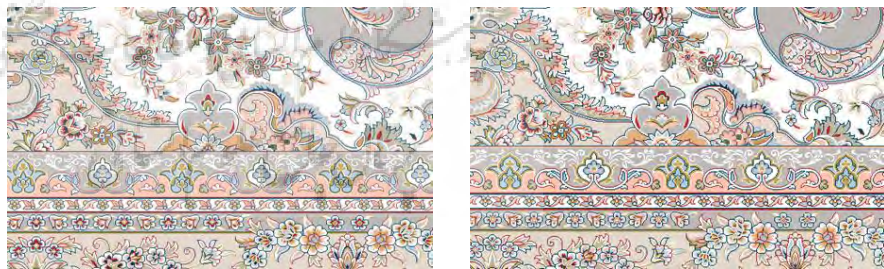
تصویر ۱۱. تغییر ابعاد نقشه قالی توسط هوش مصنوعی بوریا، تبدیل ۱۲ متری (چپ) به ۹ متری (راست).

همانطور که در تصویر ۱۱ مشاهده می شود، تبدیل سایز ۱۲ متری به ۹ متری به درستی صورت گرفته است. در برخی مواقع هوش مصنوعی قادر به تشخیص برخی نقوش در بوریا نیست و با سرهم سوار (دوبل) شدن نقطه ها، روبه رو هستیم که تصحیح نهایی، مجدداً باید توسط اصلاح کننده انسان صورت گیرد تا ایرادات ایجاد شده توسط هوش مصنوعی در تبدیل اصلاح نقشه در دو سایز به یکدیگر، توسط اصلاح گر انسان رفع گردد.