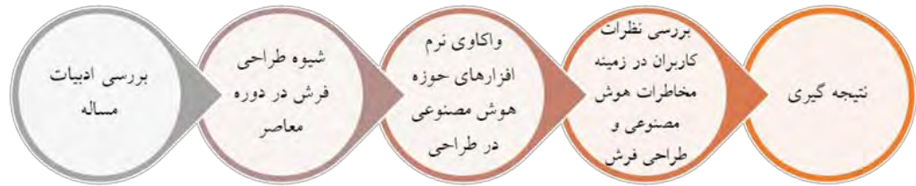
تصویر ۱. مدل مفهومی پژوهش.

در رابطه با هوش مصنوعی پرداخته شده، سپس نحوه طراحی فرش در دوران معاصر به صورت مشاهده و رفتارنگاری کاربر مورد بررسی قرار می‌گیرد؛ در ادامه با چهار نرم‌افزار رایج در حوزه طراحی و هوش مصنوعی سعی در توانایی خلق ایده برای طراحی فرش صورت گرفته است؛ در نهایت نظر کاربران را در ارتباط با هوش مصنوعی و آینده شغلی آن‌ها از طریق پرسش‌نامه، مورد کندوکاو قرار داده تا به نتایج درخوری نسبت به یک پژوهش علمی در ارتباط با مخاطرات هوش مصنوعی در آینده فرش ایران دست یابیم (تصویر ۱).