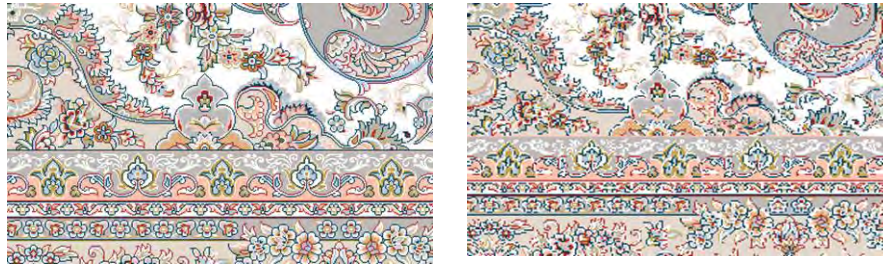
تصویر ۱۲. تغییر ابعاد نقشه قالی توسط هوش مصنوعی بوری، تبدیل قالی ۶ متری (چپ) به قالیچه (راست).

همانطور که در تصویر ۱۲ مشاهده می‌شود، تبدیل سایز ۶ متری به قالیچه‌ای با ابعاد 2.25 \times 1.5 توسط هوش مصنوعی نرم‌افزار بوری با مخاطره صورت گرفته است و هوش مصنوعی فوق‌قادر به اصلاح نقوش فرش به صورت استاندارد و کامل نیست و تمام نقوش چه از نظر طراحی، رنگ و نقطه به هم ریخته دیده می‌شود. نتایج مقایسه با چهار هوش مصنوعی در جدول ۳ نشان داده شده است: